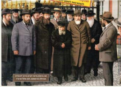
ציור מעובד של מרן החפץ חיים ז"ע על פי התמונות החדשות שהתגלו לאחרונה