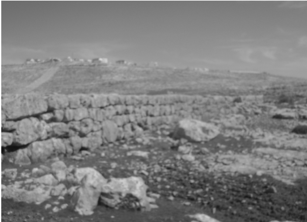
אחת ממצבות 'קבור בני ישראל' (ברקע: בתי הישוב גבע בנימין)

מי הם אותם בני ישראל שנקברו במקום? אין על כך תשובה, והיה מי שרצה לזהות כאן את קבר רחל 'האמיתי' 147 , (אף שבכתוב נאמר כי על רחל הוצבה מצבה אחת, ולא מצבות הרבה). בטרם ננסה לבדוק מי הם הקבורים במקום, יש לשים לב לעובדה הבאה: גודלן של המצבות מורה כי לא מדובר בקבורה של אנשים בודדים, אלא בקבר אחים ענק, שבו נקברו מספר גדול מאד של אנשים בבת אחת. האם ידוע לנו על מוות המוני של בני ישראל במקום זה? התשובה היא חיובית. ספר שופטים מספר את סיפור 'פילגש בגבעה', שאירע ככל הנראה בדור שלאחר מות יהושע, שתוכנו בקצרה הוא זה: אנשי 'גבעת בנימין' שמצפון לירושלים התעללו עד מוות באשה שהוזמנה למקום. בעקבות מעשה הנבלה, עלו שאר שבטי ישראל להילחם בבני בנימין. בשני ימי המלחמה הראשונים ניגפו בני ישראל לפני בני בנימין, שהרגו בהם 40 אלף איש. ביום השלישי גברו בני ישראל והשמידו כמעט את כל שבט בנימין. גבעת בנימין היתה במקום שבו נמצאת כיום שכונת פסגת זאב, 148 והמלחמה היתה בין הגבעה ובין בית אל: "בְּמַסְלֹת אֲשֶׁר אָחַז עֲלֶיהָ בֵּית אֵל וְאָחַז גְּבֻעָתָהּ בְּשָׁדָהּ" (שופטים כ, לא). כלומר, המלחמה היתה בדיוק במקום זה, שבו נגמרת הירידה מהגבעה, ומתחילה העליה לכיוון בית אל. מסתבר אם כן שהמונומנטים הקרויים 'קבור בני ישראל', מהווים גלעד לזכרם של הרוגי מלחמת 'פילגש בגבעה', שנהרגו במקום זה בתחילת תקופת השופטים.