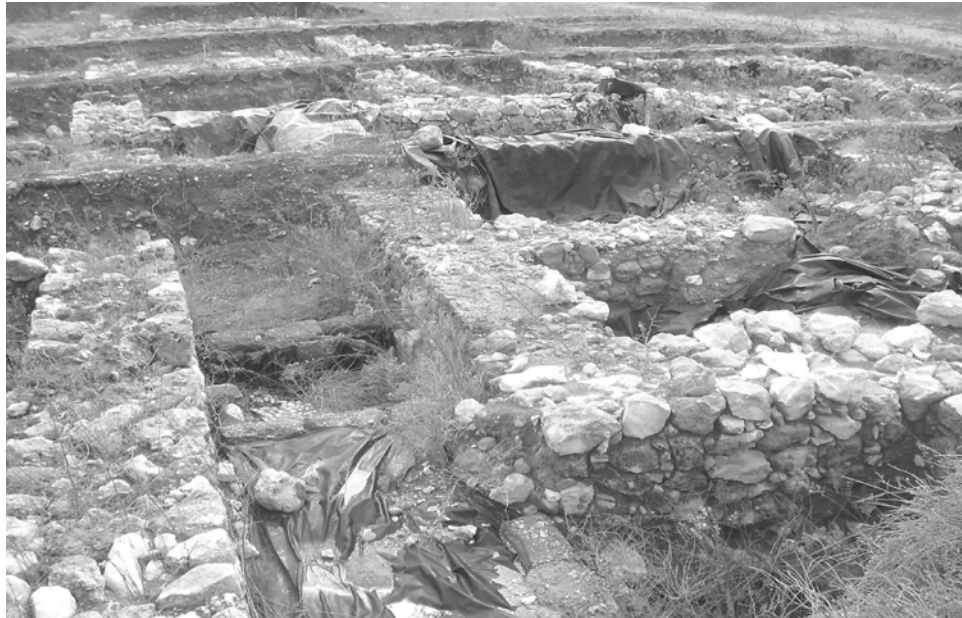
שרידי ארמון פיראם בירמות

חפירות נוספות בירמות חשפו מתקופה זו מכלול מבנים מרשים במיוחד: "המכלול מאופיין בתכנון אדריכלי מתוחכם. איכות הבניה יוצאת דופן בין מבני התקופה. מכלול זה היה מבנה ציבור מונומנטלי, כעין ארמון, ששימש למגורי השליט ולעיסוקים מנהליים". 137 החפירות הארכיאולוגיות הצליחו אם כן לחשוף את ארמונו של אחד ממלכי כנען שנלחם נגד יהושע: פיראם מלך ירמות.