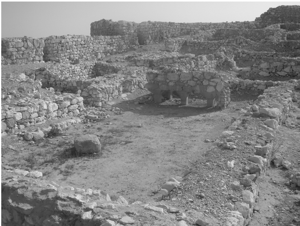
שרידי בתים בערד מימי משה