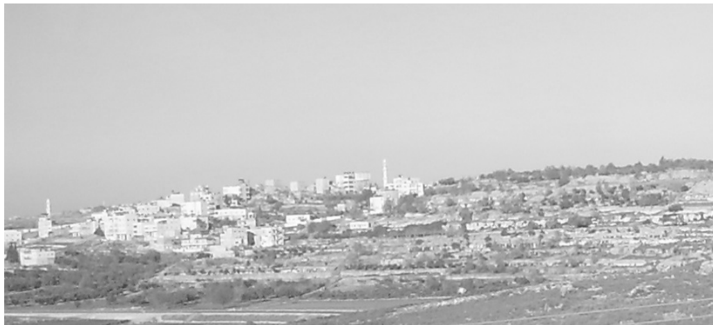
גבעון (אל-ג'יב) אשר למרגלות נבי סמואל

ב. הכתוב אומר כי קבר קיש אבי שאול היה ב'צלע' (שמ"א כא, יד), ובמקום אחר נאמר כי מוצא משפחת שאול הוא מגבעון (דהי"א ט, לה-לט). מסתבר אם כן כי 'צלע' סמוכה לגבעון (כיום: הכפר א-ג'יב), והגדרה זו הולמת היטב את נבי-סמואל, אשר גבעון יושבת למרגלותיה. אם נבי-סמואל היא 'צלע' המקראית, נוכל לזהות את האישיות רמת המעלה שנקברה בה, וגם להבין כיצד הפך המקום ל'קבר שמואל': כאן נקבר שאול המלך, ככתוב: "ויקברו את עצמות שאול ויהונתן בנו בארץ בנימין בצלע, בקבר קיש אביו" (שמ"א שם). המקום הפך מאוחר יותר להיקרא על שמו של שמואל, משום שבשפה הערבית לא נפוץ שמו של שאול, אך מוכר שם דומה לו, והוא שמו של שמואל (סמיל), וכך הפך קבר שאול לקבר שמואל. לסיכום: בנבי-סמואל לא קבור שמואל הנביא. מסתבר ששם נקבר שאול, ששמו השתבש בפי הערבים לשמואל.