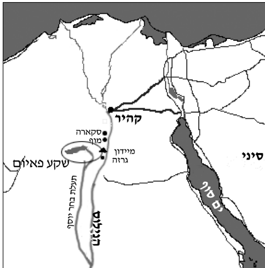
מפת מצרים העתיקה

מתאים לנאמר בכתוב, שהרי הוא מעט מדרום לעיר הבירה 'מוף', כך שהוא סמוך למקום שישב יוסף, וכדי להגיע ממוף אכן יש צורך לעלות במעלה הנילוס, וכלשון הכתוב "ויעל ... גושנה".