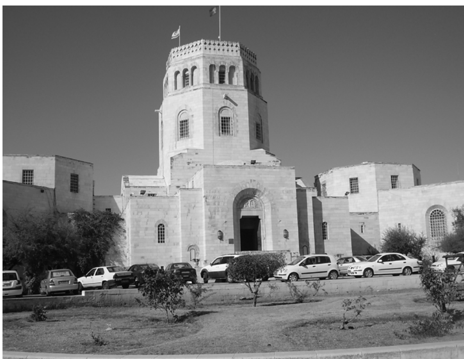
המוזיאון לעתיקות ארץ ישראל (מוזיאון רוקפלר) בירושלים