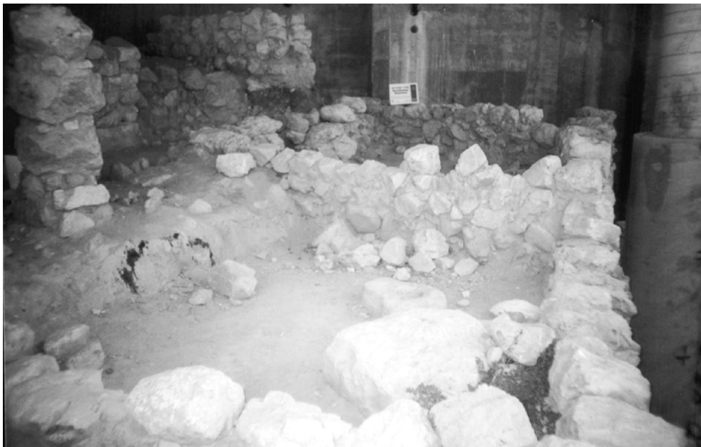
שרידי בית כנעני בחברון מימי כיבוש יהושע

כמו בערד (בפרק הקודם), גם בחברון הארכיאולוגיה נותנת את התשובה לכפל הכיבושים: היישוב התחדש מיד לאחר הכיבוש הראשון, והיה צורך בכיבוש מחדש.