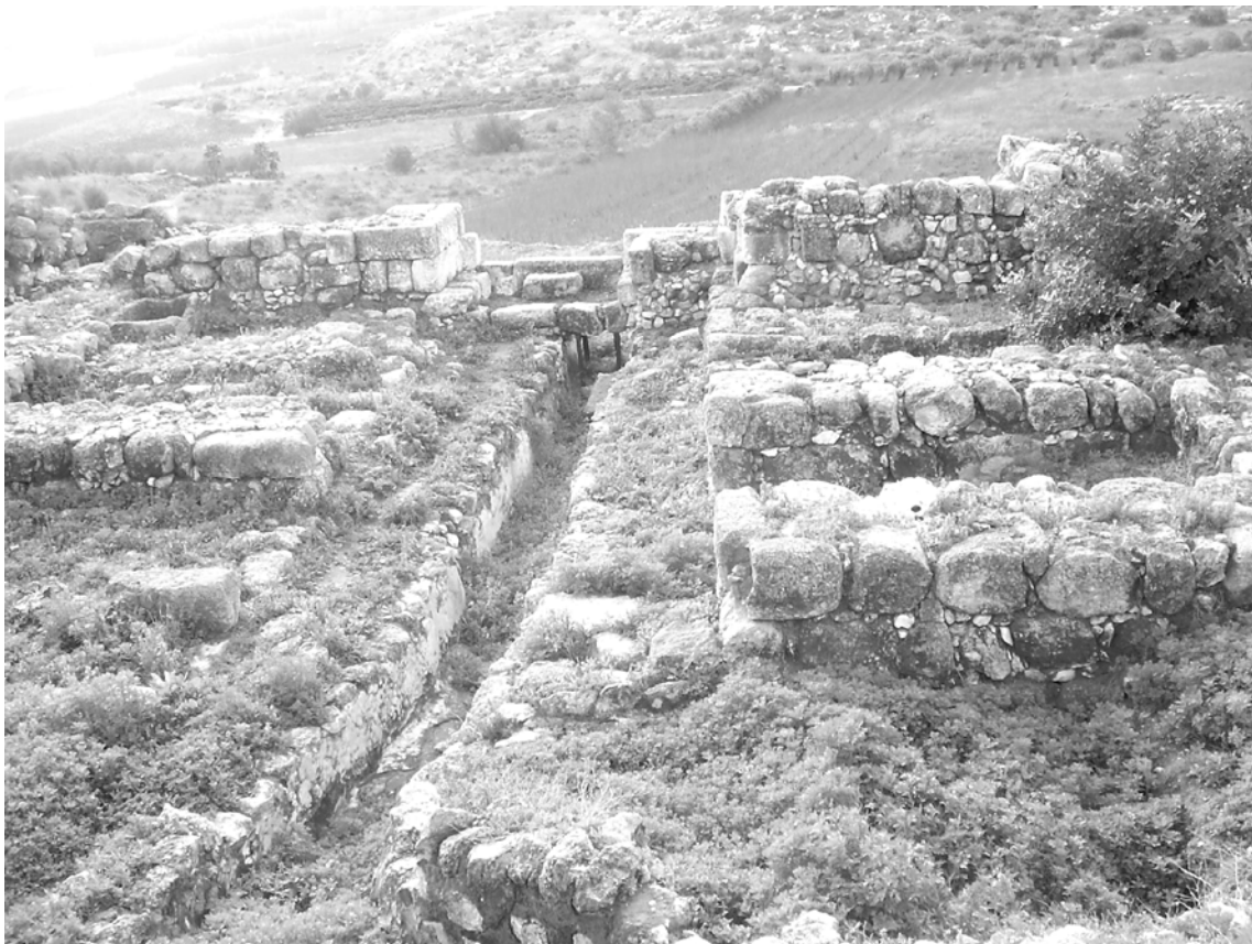
שרידי שער העיר שנחשפו בתל גזר (על יד רמלה)

בספר מלכים מסופר עוד כי בראשית מלכות שלמה כבש מלך מצרים את העיר גזר (מל"א ט, טז). מן התעודות המצריות לא ידוע דבר על כיבוש זה : "אירוע זה מעורר תמיהה ... במקורות המצרים לא נזכר כל מסע מלחמה שנערך בימי שושלת כ"א". 9 מדברים אלו (ואחרים) עולה לכאורה כי בנוגע לתקופות אלו קיימת סתירה בין המסופר בתנ"ך לבין הממצא הארכיאולוגי. מסיבה זו יש חוקרים הטוענים כי אין לקבל את המסופר במקרא, שהרי ה'ממצאים מהשטח' סותרים אותם. מאידך, יש חוקרים הטוענים כי האירועים הנזכרים בתנ"ך היו בתקופות קדומות יותר ממה שמקובל לחשוב, ובשרידים מאותם תקופות נותרו עדויות לסיפורי המקרא. להלן נלך בדרך זו, כאשר נקודת המוצא היא תעודה מצרית המכוונת אותנו לתארך את יוסף לימי שושלת ג' במצרים. על פי זה תתוארך יציאת מצרים לימי שושלת ד', כיבוש יהושע לימי שושלת ה', וימי שלמה לימי שושלת י"ב. כך נגלה ממצאים רבים המקבילים לנאמר בתנ"ך, כפי שיובא בפרקים הבאים.