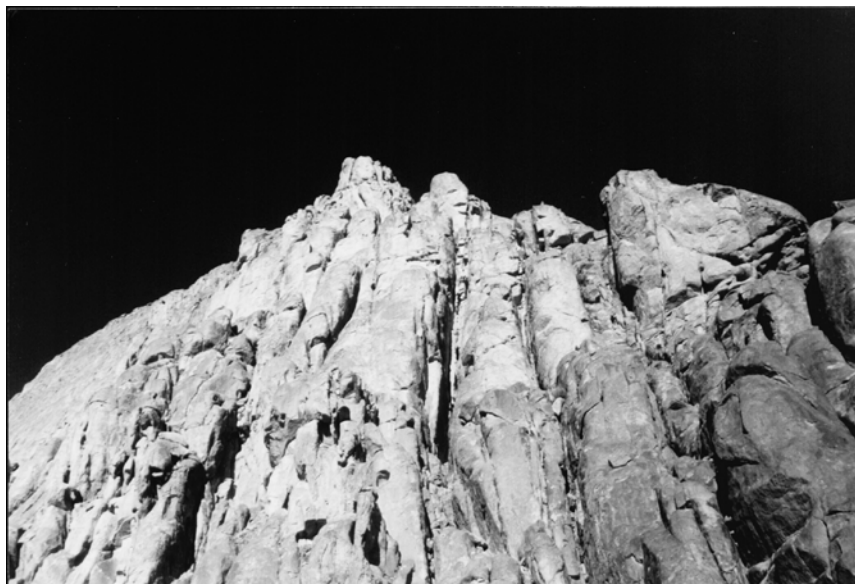
ג'בל מוסא המזוהה עם הר סיני

מאפיין נוסף: "האחידות בצורה של הנואמיס בכל רחבי סיני, מרשימה. היא מעידה על מסורת משותפת לכל אנשי החברה הזאת. ... למרות אחידות זו ניתן למצוא שינויים מסוימים בין שדה לשדה ... כל שדה שימש כאתר קבורה של קבוצה חברתית שונה, מעין שבט." 82