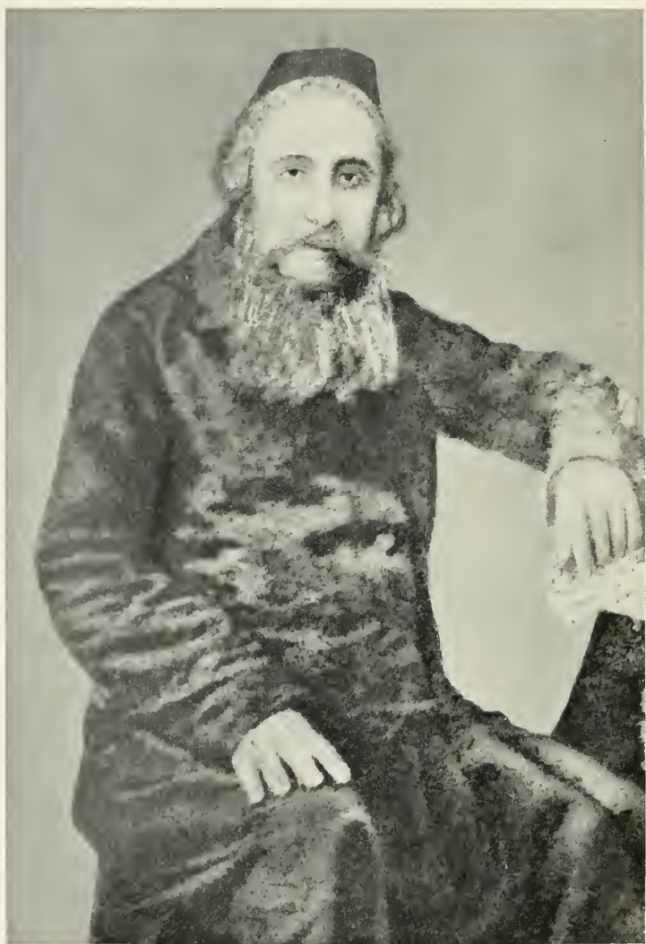
ר' ב'ר מלני