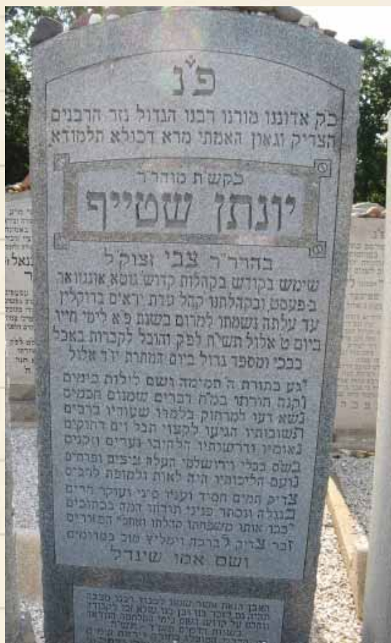
אילו היו מבינים בצדקתו היו מערימים אלו קויטלאך. ציונו הק' של רבינו

נעליים, לכן ביקש ממנו שימציא לו פרנסה, ועל זה בא עתה לבשרו שהוא מוכן לקבלו, והוא מציע לו שירות אצל. "שמח האיש מאוד, אבל תמה ושאל לו למה הצרכת לטרוח ולבוא הנה בשעה מאוחרת זו, הלא היה פנאי להציע לי זה למחר. השיב לו המכובד יפה כיוונת, ואכן לא היה בדעתי לבוא אצלך בשעה זו, אבל מה אעשה ורבינו אילצני למהר ולהציע לך משרה זו תיכף, כי אין מחמיצין את המצוות, וכשידע שהצליח למצוא פרנסה תערב עליי שנתו.