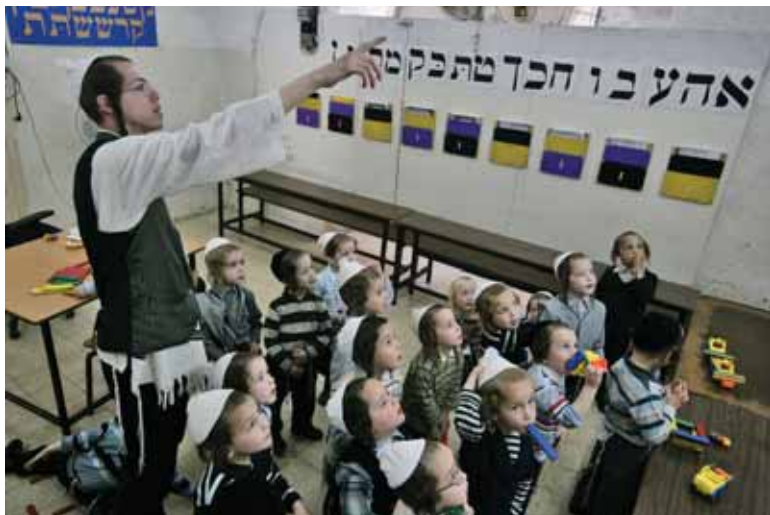
דילמת ההיכרות. מחנך בכיתה מלמד ילדים (איסטרוולציה)

כאן אנחנו מגיעים לדילמה הלא פשוטה, הנתונה לוויכוח