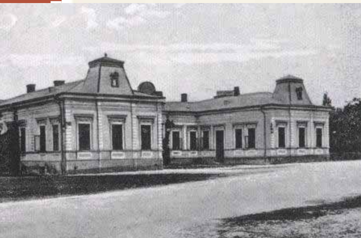
בתקופת היותו בבית הכלא שינן תלמודו וחזר על ארבעת חלקי שו"ע ד' מאות פעמים. ה'הויף' בסאדיגורה