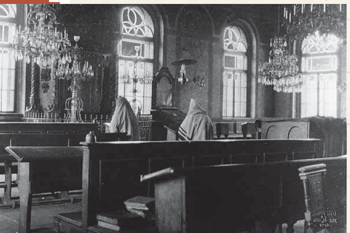
תחב אצבעותיו באזניו בזמן שהותו בבית האסורים. תמונה עתיקה מפנים הקלויז בסאדיגורה