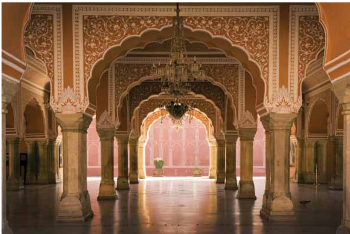
מהיכל משר בשר ודם אפשר ללמוד מעין דמעין מלוכות שמים. ארמון מלוכה