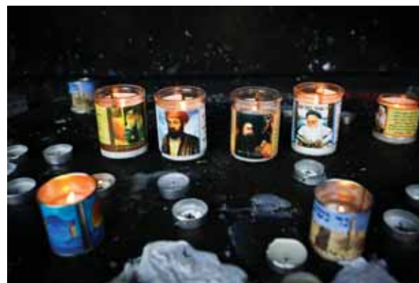
הנשמה נהנית בהדלקת נרות. הדלקת נרות לעילוי נשמת צדיקים

הואיל ובחייו לא עשה ולא ציווה אלא שעושים בשבילו? וכך הוא משיב: נאמר כי יש חילוק בין האנשים. שאם לא יזכה בחייו, לא יצילו לו כל הצדקות, אבל אם זכה [היינו שהיו לו זכויות בעולם הזה] וחטא, ובשביל עוונותיו גרשוהו מגן עדן או עושיין לו דין בגיהנם, או מייגעין אותו דרך קוצים, או מלאכי חבלה משחקין בו, או צדיק שמפני עון אין מכניסין אותו במחיצת צדיקים - אז מועיל אם מתפללים או נותנים צדקה בשבילו. או אם גזל והיורשים משיבים, או אם יתבזה המת לפחת ולמעט מעוונותיו. אבל מי שלא זכה, לאחר מיתה לא יועיל כל מה שיעשו בשביל המת אלא אם כן ציווה זה בחייו ועשו במותו.