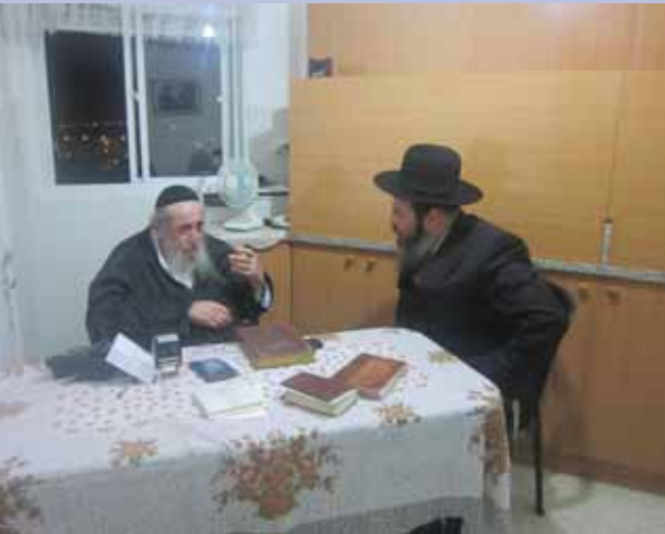
הגרד"צ אורדנטליך שליט"א בשיחה לסופר "המבשר"

לסיום אומר לנו הגאב"ד שליט"א: "סידרת חיבוריו הגאונים של הגר"י זצ"ל על הש"ס, שו"ת, על תרי"ג מצוות, וכן דרשותיו שיטה מקבצת שחיבר וכו' מעידים יותר מהכול על עוצם גדולתו ובקיאותו המדהימה בכל חלקי התורה, כך שמי שרוצה לדעת על גדולתו יעיין נא בספריו ואז ייווכח מקרוב לראות גדולת התורה עד היכן היא מגעת. זי"ע".