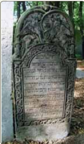
רבים השיב מעוון. המצבה בוורשה