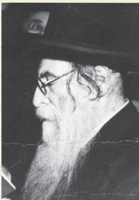
זכה שיתקבלו דבריו אצל כל גדולי ישראל. צורת קדשו