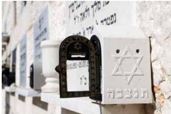
המנהג לידור צדקה 'לעילוי נשמת' כבר מוזכר מקדמת דנא. קופת צדקה