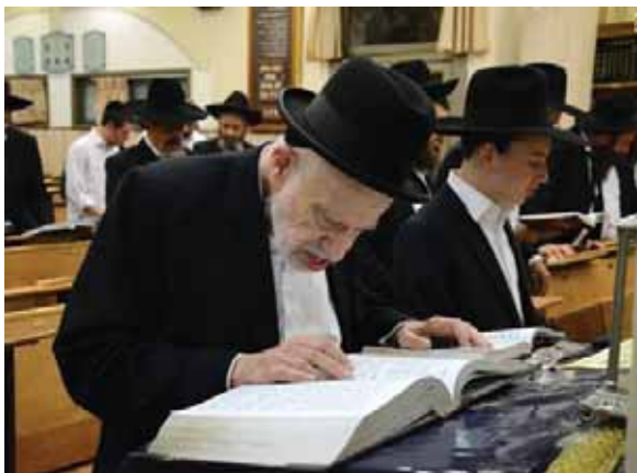
תפילת שחרית של אלול צריכה להיות שונה מכל השנה. בתפילה

ויסוד הדבר לכל זה הוא הגמרא בר"ה (ט"ז:): שאין דנין את האדם אלא לפי מעשיו של אותה שעה שנאמר כי שמע אלקים