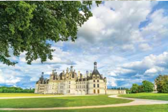
מלכותא דרקייעא כעין מלכותא דשמיא. טירה מלכותית