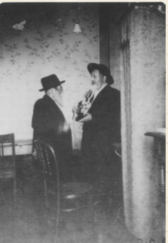
יש לנו כבר ראש ב"ד. עם הגה"ק ה"דברי יואל" מסטמאר זצ"ל

מאות האנשים ונשים שצבאו על פתחו שהיה פתוח לרווחה יומם ולילה לשאול בדבר ד' זו הלכה, ידע כל מר נפש וקשה רוח שאצלו ימצא אוזן קשבת להביע צערו ויגונו, ולהיזכר לפניו