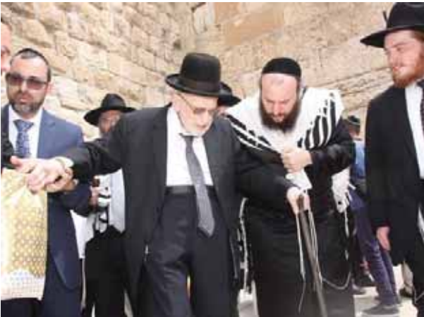
לאחוז בפלך השתיקה. בצאתו מתפילה בכותל המערבי

עלייה ע"י קיומן של חובות או הידורים הנוגעים רק בפנימיות כדביקות או התלהבות וכו' אין עלייה זו בטוחה, הדבר יוכל להתקיים איזה זמן קצר ואח"כ יחזור האדם לקדמותו כמו שהיה,, שונה הדבר אם עצם העלייה מתבטאת ע"י מעשים חיצוניים שהאדם קבלן ע"ע בחוזק גדול בלי להרפות מהן. למשל האדם שקיבל ע"ע הנהגה קבועה של כשלושה או חמישה דברים שלא נהג בהן עד היום. למשל, שתיקה בשבת ויו"ט מדברי חול, או לא לדבר בביהכנ"ס דברי חול, תפילת ותיקין וכו' הרי ע"י קיומן של דברים אלו כבר עלייתו בטוחה ואינו צריך לדאוג מכעת רק