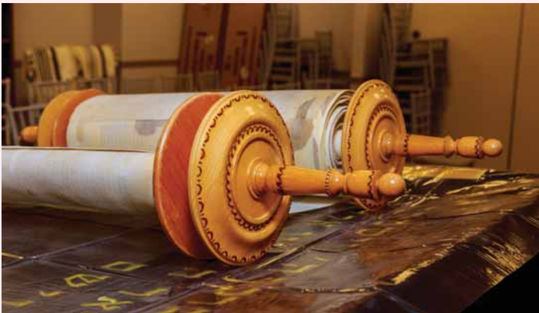
מדוע שהתורה תכתוב בצורה הנוגדת לכאורה את ההיגיון? ספר תורה

פרשת נח מסתיימת במילים 'וימת תרח בחרן' (יא לב) אך רש"י על אתר מוכיח מחשבון שנותני של תרח ושל אברהם, כי שישים שנה עברו מאז שהגיע אברהם לארץ כנען והוא בן 75, עד שמת תרח. אם כן רוב המאורעות שבפרשת לך מוקדמים ל'וימת תרח בחרן'. ואף כאן הסיבה שהזכרנו לעיל מבארת מאוד את הטעם להקדמת סיפור מיתתו של תרח. שכן בסוף פרשת נח כתבה התורה את כל קורותיו של תרח וסיימה אותן, מעתה ואילך לא יוזכר תרח כלל. לפיכך נכתב כאן גם מותו של תרח. הרמב"ן שם מדגיש זאת מאוד, בהתאם לשיטתו שאין 'מוקדם