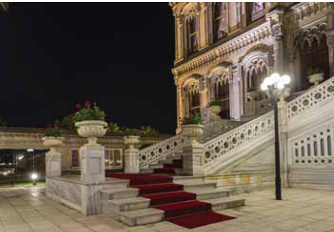
משלים ותיאורים מהיכלי המלכים. כניסה לארמון מלכות