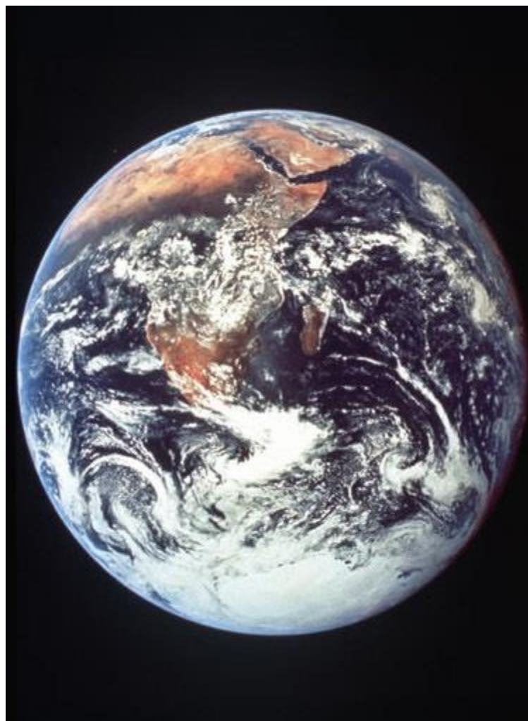
תמונה מספר 1

בתמונה מספר 1 אנו רואים שמעל הארצות שמצויים שם מדבר, השמים מטוהרים מעננים הרבה יותר