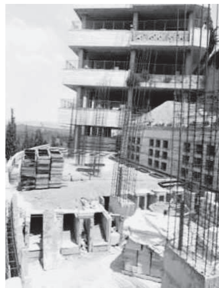
תמונה מס' 3

ובנוגע לתחתית האמבטיה התחתונה אם יש לה משטח מבטון או ששם יש עכ"פ חיבור לאדמה [דבתמונה הנ"ל הדבר אינו ברור] - השיב לי אחר שבדק בבית קברות נוסף [אף הוא במרכז אר"י] שגם הוא נבנה כעין התיאור הנ"ל [שם עושים קיר בטון באורך כ-20 מ',