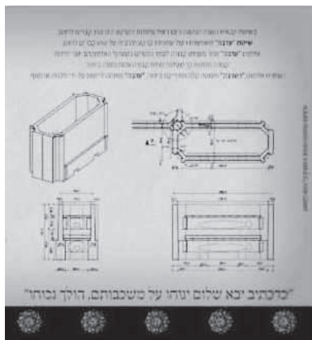
תמונה מס' 4

♦ מוריה, שנה שלוש וחמש, גליון ד-ו (תיב-תיד), שבט תשע"ז