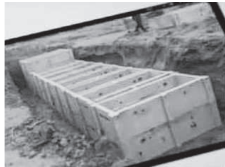
תמונה מס' 1

סוג ב: יש מקומות שחופרים באדמה תעלה ארוכה ובה מניחים אמבטיות מבטון, זו ע"ג זו, כשבכל אמבטיה אין תחתית, ויש בה נקבים בצדדים כדי שיהיה חיבור לאדמה מהצד, וקוברים מת למטה מכסים אותו עפר ו"ט ומעליו את העליון. ראה תמונה מס' 1. [בזמן בנייתן (ובתמונה זאת רואים שבסוף השורה הניחו אמבטיה שלישית על גביהם)].