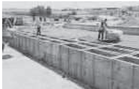
תמונה מס' 2

2 שלכאור' היא עונה על התיאור הנ"ל, אלא שבה לא ברור האם בצד השני היא סמוכה לקרקע עולם, ואנו דנים באופן שאין סמיכות לקרקע עולם].