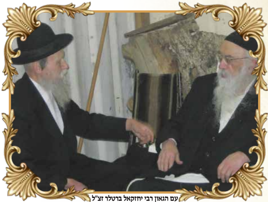
עם הגאון רבי יחזקאל ברטלר זצ"ל

ידוע כי העיון והמהירות הפכיים גם בתור-צאותיהם, העיון יסדור בנפש המשכלת המבחינת בין שקר לאמת, והמשתוקקת לאמת בלבד, ואילו המהירות הוא פרי הדמיון המשלים עם כל אשר