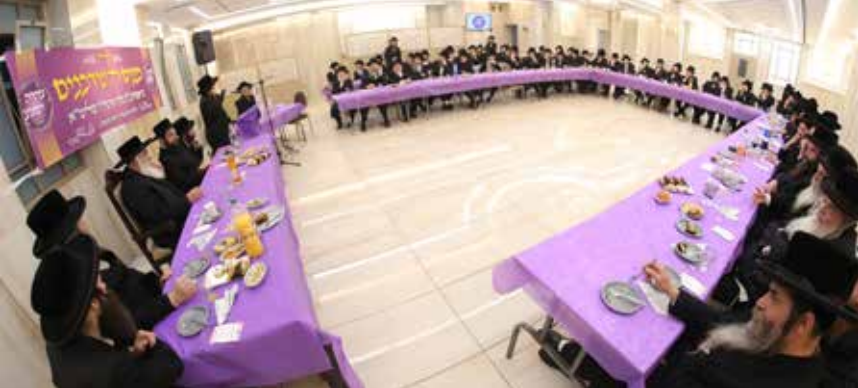
עשרות שרכני קהילת דושינסקיא באסיפת שידוכים