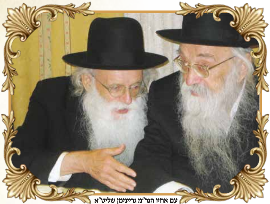
עם אחיו הגר"מ גריינימן שליט"א

המכתב הגיעני ויקרה אנחת הנאנחים, אבל בהיות ותלמיד חכם הוא שיא התכלית של העיר