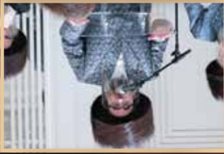
המלך משה וסגן המלך משה