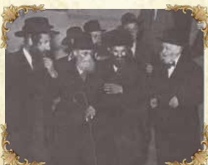
לימינו מרן הגר"ש ואזנר זצ"ל

אברכים שיש להם תוכנית סדורה ללמוד את כל התורה בעיון, ומידי שנה או שנתיים הם מוציאים כרך נוסף של עמלם בתורה בכתיבה כמו שחיך החזון איש. הנה למשל נפתח את סידרת ספרי "באר החיים", דרכה תוכל לעקוב אחר סדר עלייתו של אברך במשך כל שנותיו, א. בשנת תשס"ד כך על הלכות מקדש וקדשיו. ספר עבודה להרמב"ם. ב. עוד כך על מקדש וקדשיו ערכין וקרבנות. ג. בשנת תשס"ז כך על הלכות טומאת צרעת. ד. באותה שנה כך על הלכות ריבית. ה. בשנת תש"ע כך על נדה ומקוואות. ו. בשנת תשע"ג יוצא כך על הלכות טומאת אוכלין להרמב"ם. ז. בשנת תשע"ו כך על התורה. ח. הלכות כלים. ט. בשנת תשפ"א באר החיים ו' חלקים על ששת חלקי משנה ברורה. י. מסורת התורה.