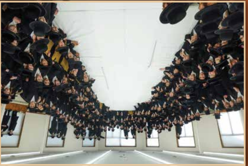
A large group of people, likely a choir or orchestra, performing on a stage. They are wearing dark clothing and are arranged in many rows, filling the stage area.