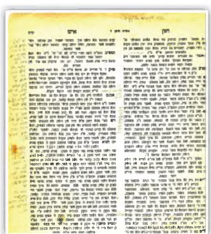
גליונות בכת"י מרובנו על ספר חזון"א

פעם אחת שאלתי לחזון"א שאלה שאם אומרים דין פלוני יש קושיא, אמר לי מי אמר שאומרים דין פלוני, ואמרת שהגר"ח הלי בספרו אומר כן, ואמר לי תביא את הספר,