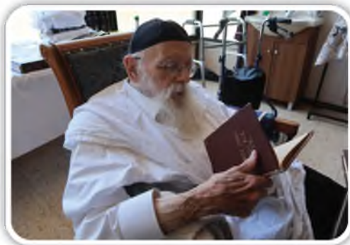
רבינו מעיין בספר אמונה ובטחון מהמדרשה הראשונה - שנת תשי"ד

בסוף ספר חזון"א טהרות שם מודפס האמונה ובטחון יש סעיף קטן שמופיע שם אך אינו מופיע בספר אמונה ובטחון, וסיפר רבינו שהוא שהחליט להשמיט קטע זה מטעמים שונים, אך אח"כ חזר בו ואמר שאם החזון"א לא מחק קטע זה הרי שחשב שנכון לפרסמו, ולכן בספר טהרות זה כן הודפס.