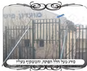
סורג מעל חלל הפתח, והמשקוף מעליו

עוד חידוש שנקט לשיטתו, כאשר יש בבית תריסים שבין החדר למרפסת, והם מחויבים במזוזה כי הם משמשים כדלת ויש להם שתי מזוזות ומשקוף, [ואין לומר שהמשקוף אינו מגיע עד מעל הצדדים העומדים, כי גם במקרים אלו עכ"פ החלק הבולט שבעמודים