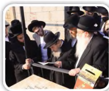
רבנו בפעם היחידה שידוע שעלה לבית החיים לקבר מרן החזו"א כשהתפלל מחוץ לגדר במרחק מהקבר