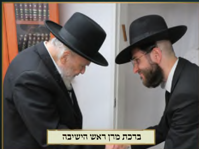
ברכת מרן ראשי הישיבה