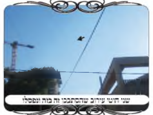
שני חוטי עירוב שהסתבכו זה בזה ונפסלו

בהמשך היה קו של צורות הפתח, וגם שם היו כמה שינויים מהצורה הרגילה בשאר השכונות, עד שהגענו למקום אחד שחשבנו שתפסנו משהו מיוחד. ברחוב המרכזי בשכונה היו שני חוטים שיצאו מאותו עמוד, דהיינו שתי צורות הפתח לשני מקומות, [באחד מהם היה משולב חצי חוט ברזל], והנה שתי החוטים הסתלסלו באמצע הדרך אחד בשני, ושניהם זזו ממקומם, עד שהם היו נראים בצורה כזו Y.