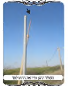
העמוד הישן מזיז את החוט לצד

בסיום הסיבוב ראינו שכל החוטים והעמודים היו שלמים לפי כללי ההלכה [ברמה העירונית]. והגענו בחזרה לחוט של תחילת הסיבוב, שבו כאמור היתה בעיה רצינית באותו מקום היה עמוד ישן ועקום, שאף הוסיפו עליו ברזל דק להגביהו, והיה במצב גרוע בעקבות כך עשו עמוד חדש לידו, וכשקשרו את החוט לעמוד החדש, לא הבחינו שהוא נתקע בדרכו בעמוד הישן, שנוטה ומסית את החוט לצד בצורה הניכרת לעין. בדיון זה שוב יש את ההלכה הנ"ל שאם החוט אינו ישר מעמוד לעמוד, אלא משנה זווית באמצע, אינו כשר.