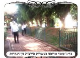
בבני עומד מרובה בעשרות פירצות בין הגדרות

עוד דבר יחיד ובוטל בעירוב בשכונה זו, שיש קטע ארוך שמסתמך על דין "עומד מרובה על הפרץ" בכמה עשרות פירצות כיצד יתכן? בקטע אחד בעירוב הגובל עם השדרה, עשתה העירייה גדר מסודרת אך לא שלמה, אלא עם רווח של מטר וחצי בין חתיכה אחת לשניה.