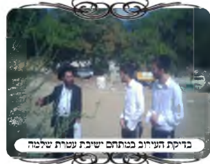
בדיקת העירוב בנתיבי ישראל

בדיקה אחרת של עירוב מהודר, התקיימה בישיבת עטרת שלמה, לבקשת הבחורים העוסקים בעירוב, עברנו יחד לראות כל פינה וכל חור בגדר, האם יש בו חשש כלשהו, ברמת ההידור הראוי.