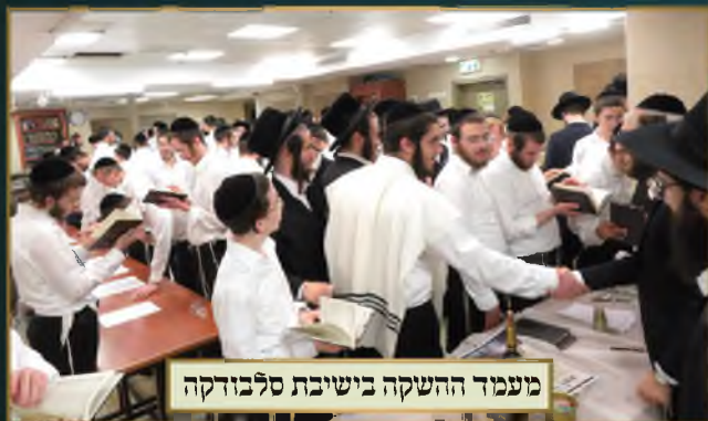
מעמד החשקה בישיבת סלבדקה