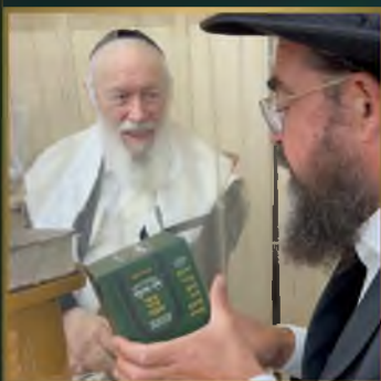
מועדון עמוד ההוראה הגר"י זילברשטיין שליט"א