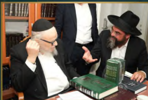
מועדון ראש הישיבה הגרמ"ה הירש שליט"א