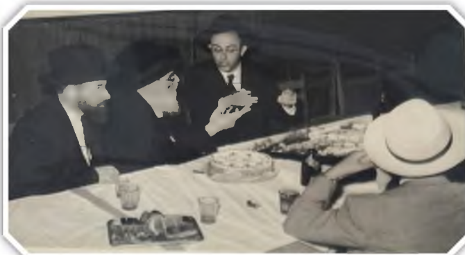
תמונה נדירה - מון הגרא"י פינקל ראש ישיבת מיר בשמחת נישואי רבינו שליט"א

לפני שנים אחדות פגש רבינו שליט"א בירושלים את הגאון רבי חיים אורי פריינד שליט"א חבר בד"צ העדה החרדית, לאחר פריסת שלום אמר הגרא"א לרבינו - ראש ישיבה שליט"א יש לי הכרת טוב גדולה עליכם,