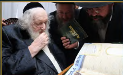
מועדון פוסק הדור הגר"מ שטרנבוך שליט"א