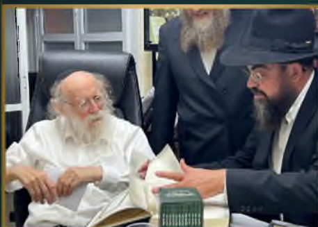
מועדון הגר"ש גלאי שליט"א