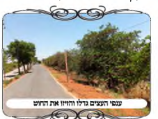
ענפי העצים גדלו והזיזו את החוט

ב. כאשר הענף גדל יותר ודוחף את החוט הצידה גם בלי שיהיה רוח, וכל השבת החוט הולך בצורה קשתית לצד. דין זה יש לתלות במחלוקת בדיון חוט המתנדנד ברוח, שלדעת הסוברים שאם החוט מתעגל מחמת הרוח והאמצע יוצא מבין העמודים נחשב שהחוט מן הצד, פשיטא שבמקרה שהענף מזיז נפסל העירוב. אלא גם למתירים חוט מתנדנד ונאמר שישברו שגם יוצא מבין העמודים אינו נחשב מן הצד [שי"א שבזה לא התירין]. מ"מ בפשטות היינו דוקא בחוט שבעיקרון עומד ישר, והנדנד אינו קובע את צורתו, אבל אם יהיה פתח מברזל שהמשקוף שלו יהיה מעוגל לצד לכיוון הרחוב שמחוץ לעירוב, בזה הבינו הרבנים שאין להחיר.