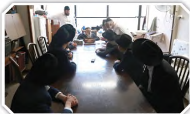
הדברים נאמרו לבחורי ישיבת 'חכמת התורה' במונדיעין עילית שעלו למעונו לרגל תחילת לימוד הלכות שבת בישיבה

לאחר מכן התעניין רבינו באיזה חלק של הלכות שבת אוחזים כעת, וכשהשיבו שאוחזים בדיני שכירות מגוי, אמר שאולי עדיף ללמוד קודם את ההלכות הנוגעות למעשה כבודר ומוקצה שזה בעיקר מה שצריך לדעת כדי להנצל מאיסורי שבת.