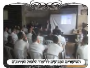
השיעורים הקבועים ללימוד הלכות העירובים

בין הדברים שנידונו היה אחד הדברים המצויים ביותר בעירובים, והחומרה שלו גדולה מאוד, כאשר ענפים של עץ גדלו והזיזו את החוט. בדבר זה יש כמה מקרים שונים, א. בתחילה הענפים מגיעים רק עד החוט, ואז ברוח הם מתנדנדים ומנדנדים איתם את החוט, בנדנד משמעותי מאוד, לפעמים החוט זז אפילו חצי מטר. בדיון זה יש להסתפק האם נחשב חוט שאינו עומד ברוח מצויה, [שדינו תלוי במחלוקת הפוסקים המובאת במשנ"ב סי' שס"ב ס"ק ס"ד], כאשר מצד עצמו אם היה לבד לא היה מתנדנד ברוח, אבל חוזק הנדנד של הענף מזיז אותו. וי"ל שספק זה תלוי אם הדין עומד ברוח מצויה הוא ענין של שיעור