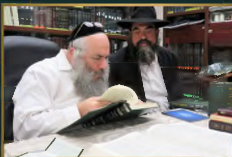
מועדון הגר"ש קניבסקי שליט"א