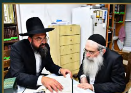
מועדון הגר"ש שטיינמן שליט"א