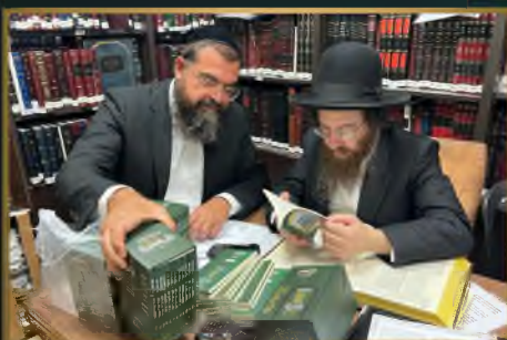
מועדון הגר"ע פריד שליט"א