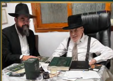
מועדון הגר"י אזרחי שליט"א