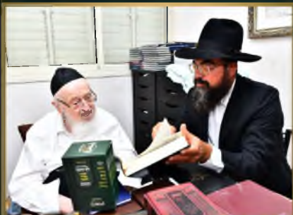
מועדון ראש הישיבה הגרמ"צ ברגמן שליט"א