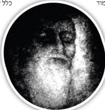
תמונת השאגת אריה

ראיתי הסכמה של השאגת אריה שכותב על הגאון התומים בספרו יערות דבש, וכותב עליו הצדיק לפני הגאון, ובעיני זה היה תמוה למה כתב כך צדיק לפני גאון, וחשבתי פשט כי הרי רדפו את התומים מפני שחשבו ששייך לכת הש"צ, לכן הקדים את התואר הצדיק.