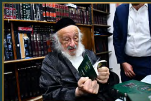
מועדון ראש הישיבה הגרמ"ד פוברסקי שליט"א