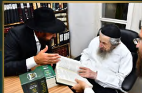
רבינו מועדון גאון ישראל הגר"ד לנדו שליט"א