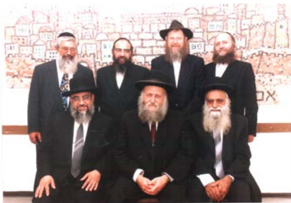
כב' הרב הראשי לרוחניות במחיצת רבני העיר, העומד למעלה בצד ימין הם כותב המאמר

תהא נשמתו הטהורה צרורה בצרור החיים להמליץ טוב בעד משפחתו ובעד כלל ישראל!