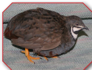
Bobwhite Quail ובלשון לאטיין Colinus Virginignus והוא ג"כ מצוי בארה"ב