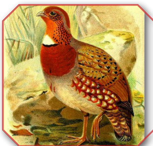
Chestnut Breasted Partridge ובלשון לאטיין Arborophila Mandellii