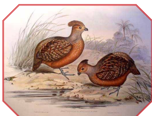
Starred Wood Quail ובלשון לאטיין Odontophorus Stellatus