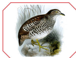
Barred Button Quail ובלשון לאטיין Turnix Susicator