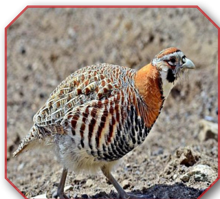
Tibetan Partridge ובלשון הלאטיין Perdix Hadgoniae