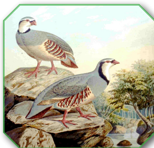
Rock Partridge ובלשון הלאטיין Alectoris Graeca