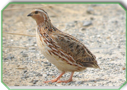
Japanese Quail ובלשון לאטיין Coturnix Coturnix Japonica

(בקונטרסו שם), שניהם נוטים לומר דהם באמת מין אחד ורק מומחה גדול אפשר להכיר ביניהם, וע"כ אין צריך לזה מסורה בנפרד.