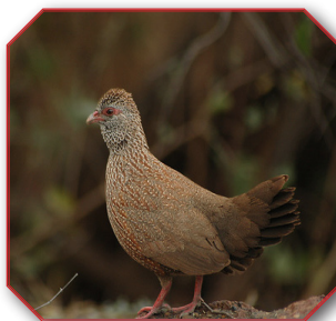
Stone Partridge ובלשון לאטיין Ptilopachus petrosus