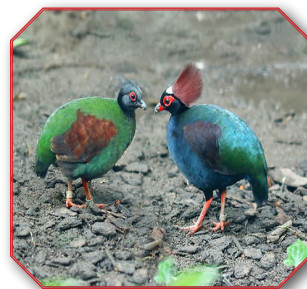
Crested Wood Partridge ובלשון לאטיין Rollulus Rouloul