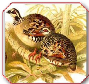
Bar Backed Partridge ובלשון לאטיין Arborophila Brunneopectus