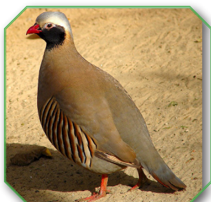
Philby Partridge ובלשון הלאטיין Alectoris Philbyi

וכן יש עוד כמה מינים ממשפחת Alectoris (חוץ מב' מינים הנ"ל) ואלו הם: