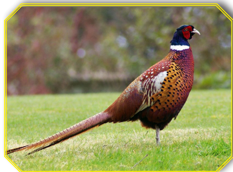
Pheasant ובלשון לאטיין Phasianus Colchicus

ועי' בשו"ת לאא"ז מהר"י שטייף (סי' ר"ב) שנקט כן בפשיטות, וז"ל: וחבר אחד העתיק לי תשובה מאגרת שד"ל, החכם ר' שמואל דוד לוצאטו, שכתב שהעוף הנקרא פאזאן בלשון אשכנז אוכלין אותו באיטלקיא עפ"י מסורה והוא בחזקת טהרה גמורה והיתר גמור בלא שום פקפוק עכ"ד (החכם הנ"ל, ועי' מוסיף לאא"ז ז"ל, וז"ל) ואם שהחכם הנזכר לא נודע בשערי הוראה, עכ"ז בוודאי נאמן ע"ז, כיון שהוא מילתא דעבידי לגלוי, וציינ למש"כ הערוך, ומוסיף הערוך שפסיוני הנזכר בתלמוד קידושין ל"א. הוא פאזאן, ורש"י כ' שהוא מין שליו, וכן הוא בש"ס ביומא ע"ה:, וא"כ בוודאי הוא עוף טהור דהא ישראל אכלו שליו במדבר, עכ"ל.