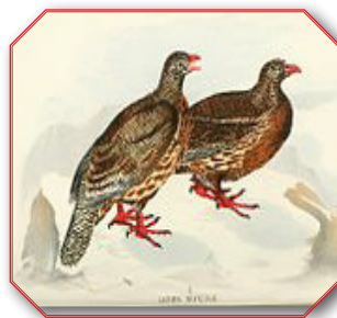
Snow Partridge ובלשון לאטיין Lerwa Lerwa