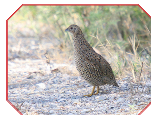
Australian - Brown Quail ובלשון לאטיין Coturnix Ypsilophora