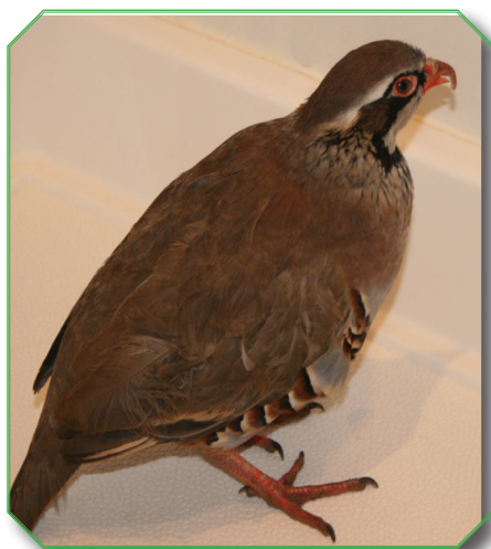
Red Legged Partridge