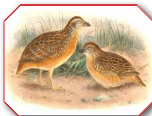
Red Chested Button Quail ובלשון לאטיין Turnix Pyrrhorthorax