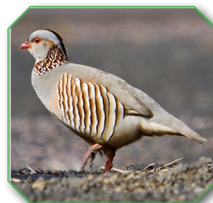
Barbary Partridge ובלשון לאטיין Alectoris Barbara