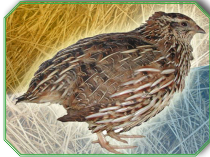
European Quail ובלשון לאטיין Coturnix Coturnix

שאכלו בבערלין בקהלתו של הרב הילדעסהיימער ובעל המחבר מלמד להועיל, ובפרט שיש הרבה עופות הדומים לעוף זה שצריך לזה דקדוק גדול שאין לסמוך על סתם אנשים ולא נחשב זה מסורת ואין לשוחטם, ואף אם היתה