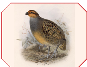
Tawny Faced Quail ובלשון לאטיין Rhynchortyx Cinctus