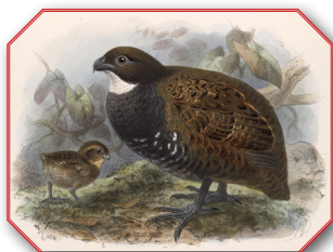
Black Breasted Wood Quail ובלשון לאטיין Odontophorus Leucolaemus

יש עוד הרבה מיני Quail שיש להם שינויים גדולים מה-European Quail, ועליהם אין מסורה, ואלו הם: