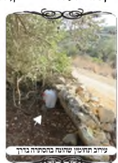
עירוב תחומין שהוגש בהסתייגות בדרך

הנהגת עירוב תחומין בנקודה בהר לצורך אנשי הביטחון מתוך השאלות שהגיעו למוקד העירוב ביום שישי האחרון, היו כמה בקשות לעירובי תחומין, חלקם מאבירים שחששו שיצטרכו בשבת להגיע לבית חולים ללוות את נשותיהם ללידה, או לבקר חולה. וגם היתה שאלה מאנשי ביטחון באחד הישובים בשומרון, שהיו צריכים לצאת בשבת לשמור בצומת המובילה לישוב, שנמצאת במרחק שני קילומטרים, ולחזור לישוב בשבת.