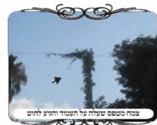
צמח נטפס שעלה על העמוד והגיע לחוט

מעמד גבוה לעמוד נמוך (שעה"צ סי"ש"ב ס"ק מ"ד), ועוד מקומות]. ב. יש עוד בעיה שכאשר הצמח נכרך על החוט, הוא גורם לפעמים לשינוי בצורת החוט. וזה לא בשלב ראשון, אך כשהצמח מתעבה יותר גם זה יכול להיות. כמו כן הצמח גורם הכבדה לחוט, ועושה שישקע.