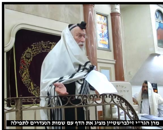
מרן הגר"י זילברשטיין מציג את הדף עם שמות הנעדרים לתפילה

'אנשים הגיעו אלינו באמצע הלילה, מרוטים וסחופים עד דכא, ותיארו את סבלם ויגונם בעקבות חוסר-המידע אודות יקיריהם, וביקשו שנתפלל לשובם בריאים ושלמים', הוסיף הרב, והמחיש את המצב