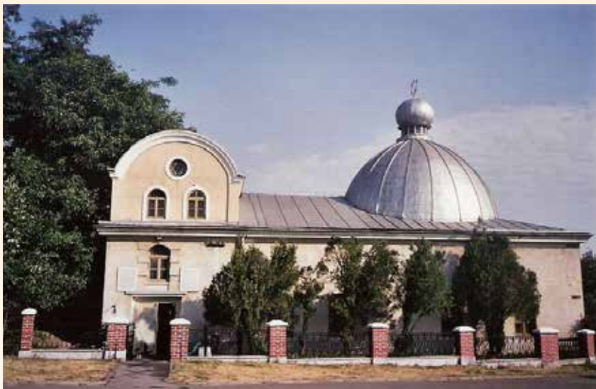
בתקופתו מנתה הקהילה היהודית ביאסי כ-40,000 נפש. בית הכנסת הגדול ביאסי