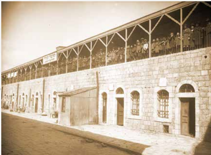
תלמוד תורה וישיבת בתי אונגריין - שומרי החומות בירושלים

על כל אחד ואחד לדאוג שהמלמדים הממלאים את תפקידם מתוך מסירות יוצאת מן הכלל יקבלו את משכורתם, כי אי אפשר לדרוש היום חרפת היהדות החרדית.