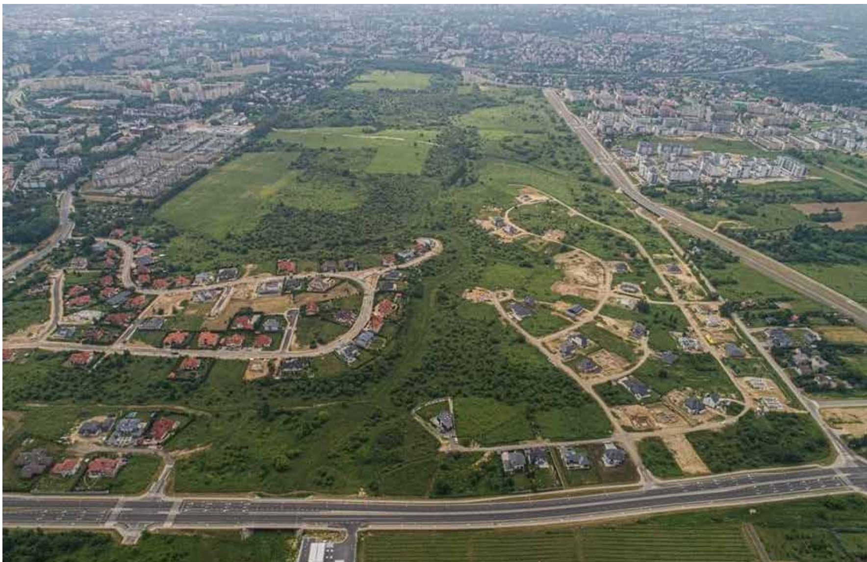
משקיע נדל"ן שהתכוון לפתח באזור דירות מפוארות ומרכז מסחרי. מבט ממעוף הציפור על האזור כולו

אין זה סוד בלובלין. כל תושב לובלין ידע בלבו כי גורקי צ'כובסקי היא חור שחור. חור שחור שמעדיפים שלא לדבר עליו. שכנים שהתגוררו בסמוך לפארק ידעו לספר כי המקום שורץ