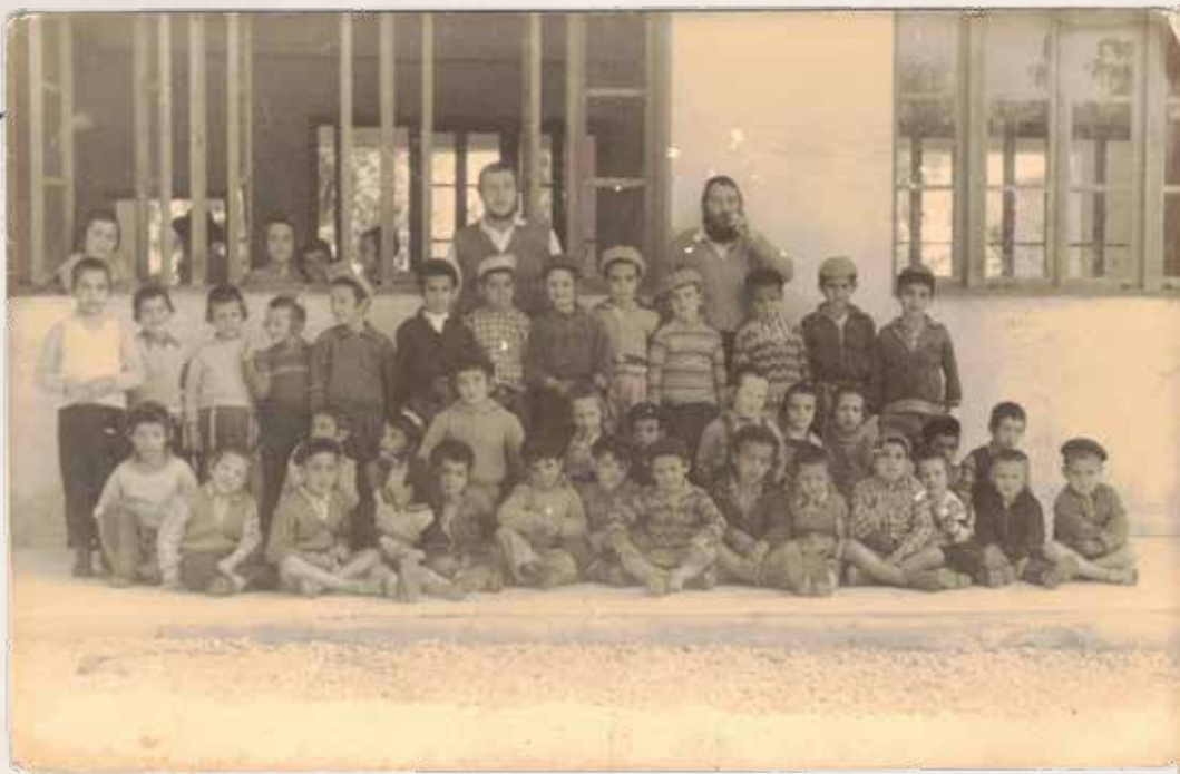
ב'ימי חורפו. עם תלמידיו בת"ת אור תורה בטבריה

רבי רבבות תלמידיו, אלפי אנשי ההוראה והמנהלים, כך עמד בעוז ותעצומות מול גורמי הממשלה, שניסו מפעם לפעם להתערב בתכני החינוך, או להצר את צעדי מוסדות החינוך התורניים, לקצץ בתקציבים או למנוע הקמת והתפתחות בתי ספר במקומות