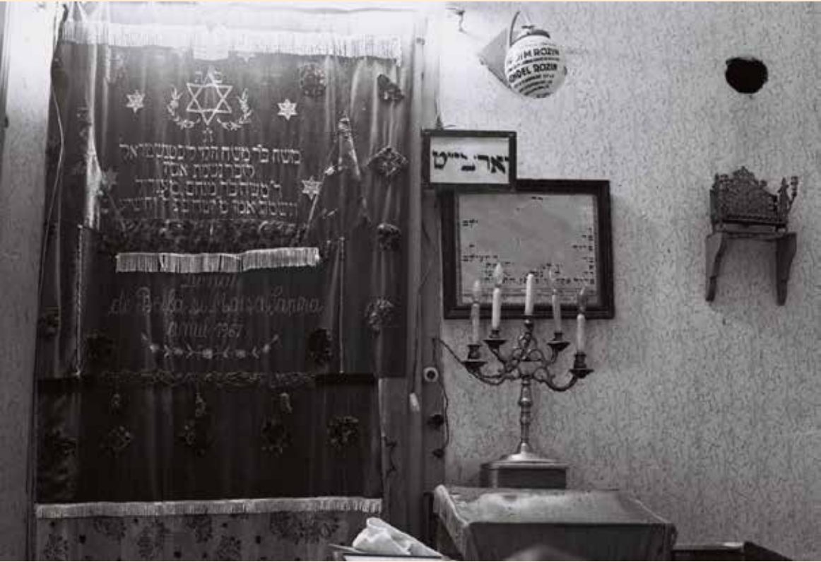
רוב בתי הכנסת נשאו שמות של מקצועות. בית כנסת הנגרים ביאסי