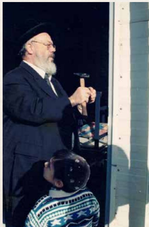
רב פעלים. קובע מזוזות בפתח מוסד חינוכי בבית שמש, תשנ"ז

גולת הכותרת בראש מפעליו העצומים – וכמעט האחרונה שבהם – הייתה הקמת שרשרת בתי ספר תיכוניים בפריפריה, בתי ספר שעל כל אחד ואחד הקיז ממש את דמו, ועד סוף ימיו עמדה הרשת על 11 סניפים, כל סניף גדול ועומד בזכות עצמו.