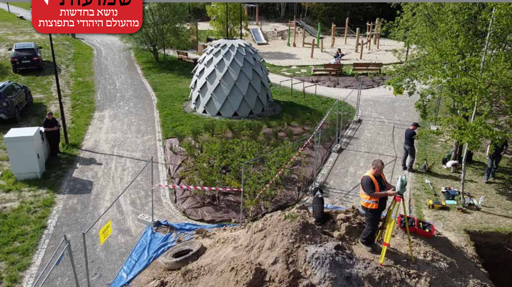
בימים האחרונים הגיעו שוב צוותים ארכיאולוגיים. הצוותים בעבודתם

כדי לבחון את הממצאים במקום, ובדו"ח שפורסם אכן אישרו כי באזור בו בוצעו החפירות הארכיאולוגיות אכן מדובר בממצאים אנושיים וכי הממצאים הם עצמות אדם. הדו"ח כולו פורסם, ולמי עשה אישר כי מרבית הסיפורים שסופרו על גורקי צ'כובסקי אכן הם נכונים.