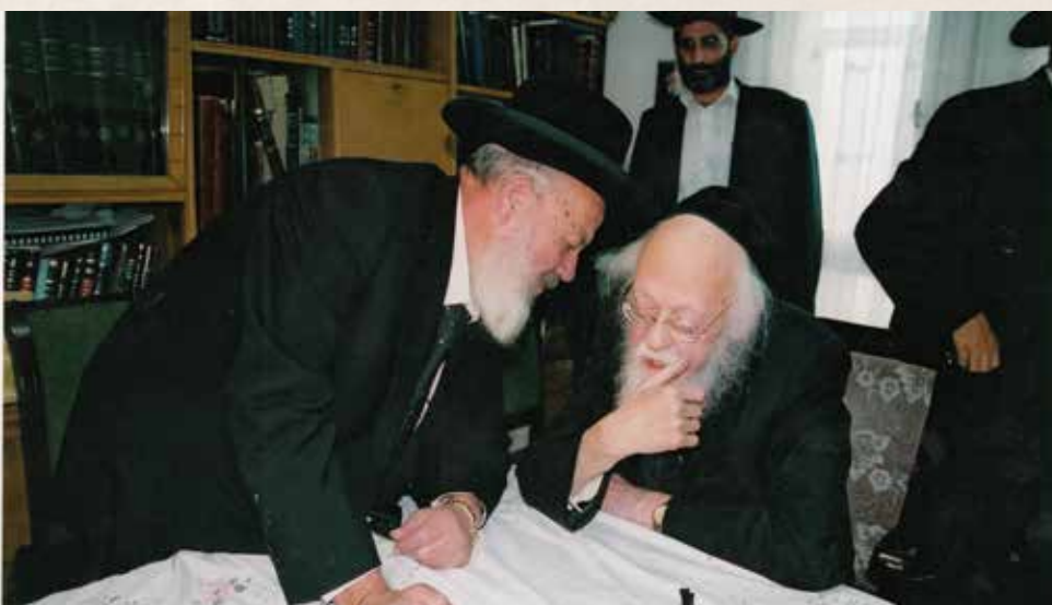
נוטל עצה מן הזקנים, ולא נכשל. התייעצות חינוכית הלכתית עם מרן הגר"ש אלישיב זצ"ל

בשנותיו האחרונות, כל עוד נשמתו ורוח אפו בו, התמסר לה קים ולבצר את 'קרן ההסעות' של החינוך העצמאי, קרן שבמשך שנים ארוכות מרן הגרא"ל שטיינמן זצ"ל תמך וועודד ועשה כל מאמץ לביסוסה החמרי, כולל נסיעות לנדיבי עם בחוץ לארץ.