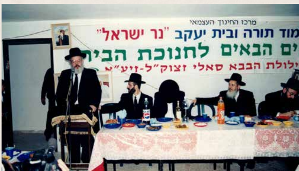
בכותל המזרח. נושא דברים במעמד חנוכה הבית לת"ת נר ישראל ביהוד, שנת תשנ"ח