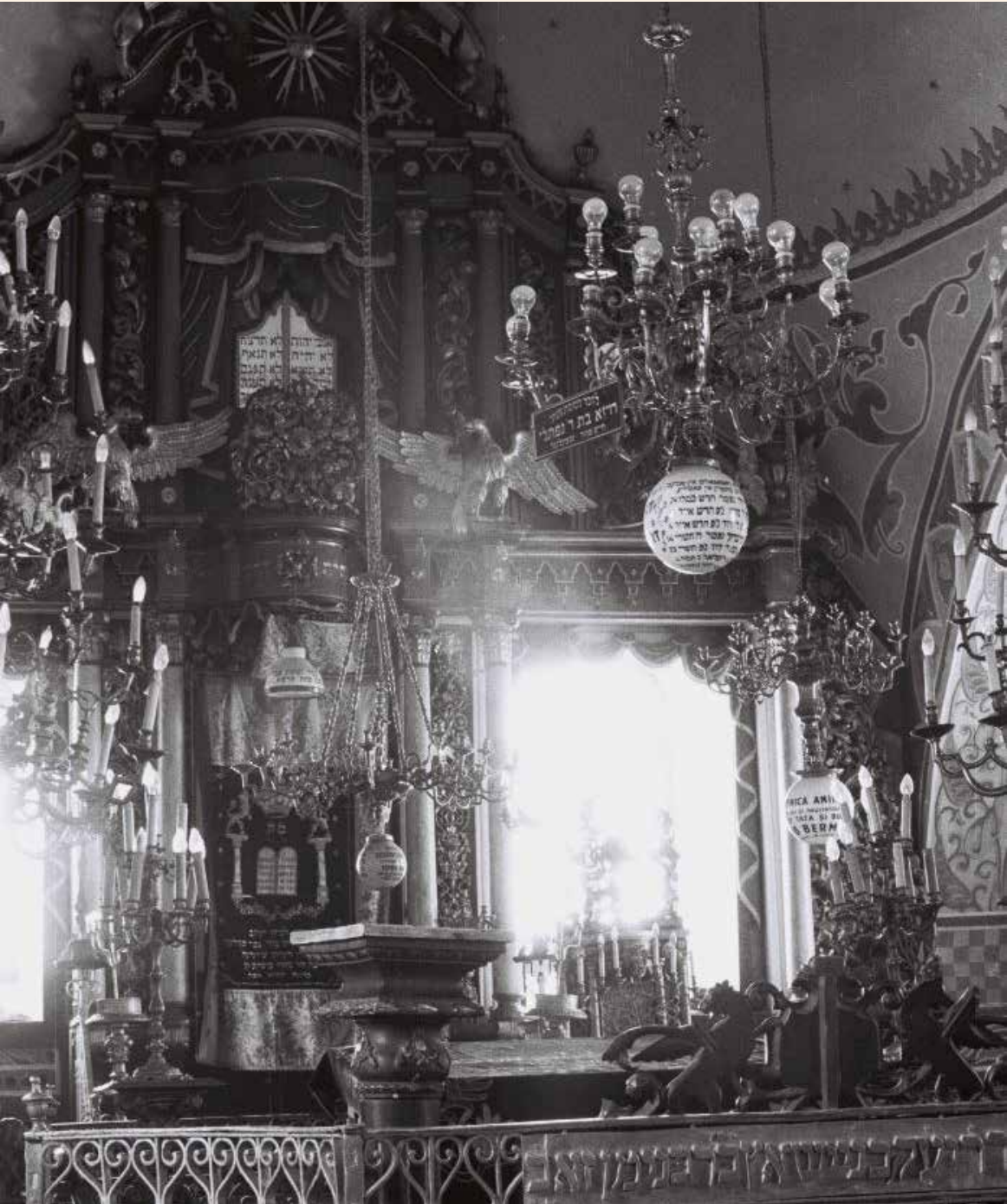
היו אז יותר ממאה בתי כנסת פעילים. פנים בית הכנסת המרכזי

בתחילת הסדר אבא היה לוקח את שלוש המצות, מברך עליהן, מודיע כי המנה הראשונה היא לכהן, השניה ללוי והשלישית לישראל. אז אב היה מוזג יין לגביעים שלנו, וכן, כמובן, את כוסו של אליהו הנביא. אבא היה עושה את הקידוש בהתלהבות מיוחדת, ובבית שררה דממה גמורה. כולם הקשיבו בהתרגשות. הייתי הילד הקטן ביותר, ותמיד הייתי זה שהציג את הקושיות של "מה נשתנה" שבהגדה. אימא והמלמד שלי