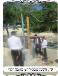
ארון חשמל מסתיר חצי מגובה הלחי

בצד אחד היה צריך לחבר עמוד ולחי לגדר, אך היה לפנינו ארון חשמל קטן, שהוא מסתיר חלק מגובה הלחי. במקרה זה הארון היה בגובה כחצי מטר, דהיינו שאינו בשיעור מחיצה, ובפסולות במצב כזה אין בעיה שהלחי יהיה