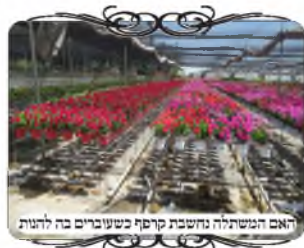
האם המשתלה נחשבת קרפף כשעוברים בה לחנות

ישוב נוסף שהגענו השבוע לעשות לו תכנית לעירוב, בעקבות בקשה של תושב שהתחזק, ואמרנו לו שאינו יכול להוציא את המפתח מהבית כשהולך