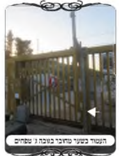
השער בשער מחובר בגובה ג' טפחים