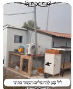
לול קטן לתרנגולים העומד בחצרו

אמנם י"ל שדין זה תלוי במחלוקת בהבנת הפסול של עמוד בתוך חצר המוקף במחיצות, שהמקור חיים כתב לפסול וז"ל, "דמה שעומד בתוך דבר המוקף לאו כלום הוא דבר המוקף כמאן דמליא דמי. וזהו פשוט אין צריך לראיה". ודיקו בדבריו שפוסל רק בדבר המוקף שהוא כמאן דמליא, והיינו שדינו כרשות היחיד גמורה, אבל היקף שאינו רה"י אינו פוסל גם אם העמוד מאחורי המחיצה. ולפי"ז רק במקרה של הלול העירוב נפסל, ובגג של הבית אינו נפסל. אבל העירו בספרים שזה תמוה, שהרי אין דין כמאן