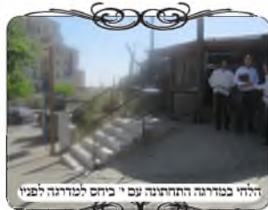
הלחי במדרגה התחתונה עם י ביחס למדרגה לפניו

בצד שני היו מדרגות, שיוצאות מהיכל הישיבה אל הרחוב, ושם באמת יש את הבעיה הנ"ל, שאם הלחי עומד על מדרגה נמוכה, וגובהו רק כעשרה טפחים, הרי כלפי הקרקע שלפניו [שהיא המדרגה שלפניו] הוא גבוה רק ט' טפחים, א"כ הוא לא גודר כלפי