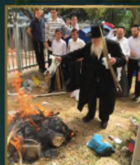
הגאון רבי מרדכי אויבך בשופת המץ