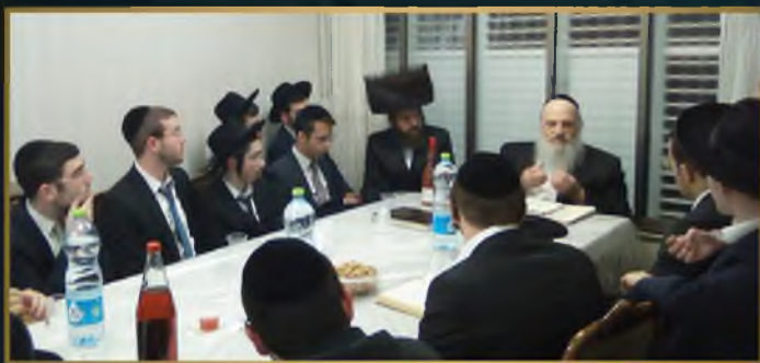
הקבלת פני רבו במעוזו של מרן הגאון רבי חיים פיינשטיין שליט"א