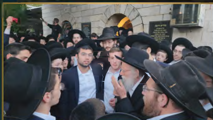
מרן הגר"ש גלאי עם ילדים מירושלים בקברי צדיקים