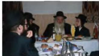
תמונה לא מוכרת של רבינו משתתף בשמחת בר מצוה לבנו של רי"א ז"ל

רבינו קם ממקומו ומיהר לבית ההוא, הוא טיפס במאמץ על קיר המרפסת שהיה פתוח אל החצר, והשתלשל אל תוך הבית, ושם עזר לילד לדלג על הקיר ולצאת, ואח"כ יצא בעצמו החוצה.