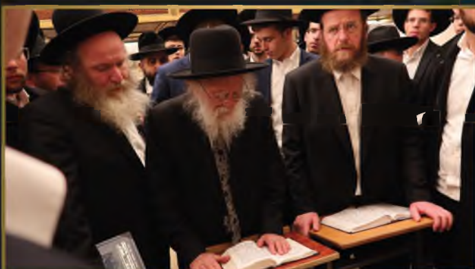
מרן הגר"ש גלאי בכותל המערבי