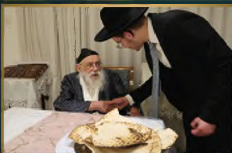
מרן הגר"מ גריינמן בחג הפסח