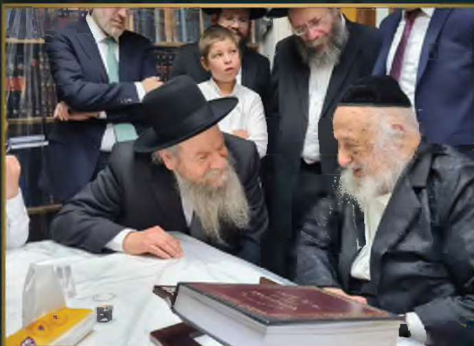
עם מרן הגרמ"ש אדלשטיין