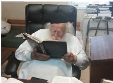
תמונה נדירה רבינו זצוק"ל בלימודו עם משקפיים

ויעוין בספר דרך חכמה (פ"י מהלכות כלי המקדש ה"ג ביאור הלכה ד"ה מניח) שכתב, שלכך לא הוי תפילין יתור בגדים, שאין בהם ג' על ג', והא דכתב הרמב"ם (שם ה"ח) דצלצול קטן הואיל וחשוב הוי יתור בגדים אפילו בפחות מג' על ג'. י"ל שהוא חשיב כי הוא בגד וצריך להשתמש בו, אבל תפילין שאינו לצורך בגד, אלא לצורך מצוה, והוא תכשיט ולא בגד אינו חוצץ. ומה שאמו בשבת (ס"א ב') תפילין דרך מלבוש, אין הכוונה שהוא בגד, אלא שהוא דרך לבישה, אבל בגד לא הוי. וכמו כן