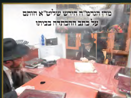
מורן הגרמ"ה הידעש שליט"א חותם על כתב ההכתרה בביתו