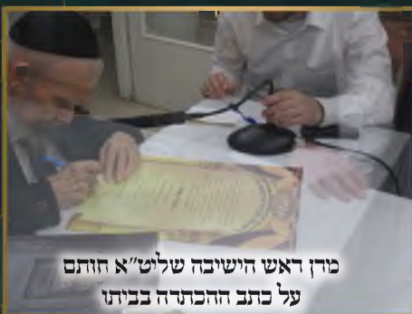
מורן ראש הישיבה שליט"א חותם על כתב ההכתרה בביתו