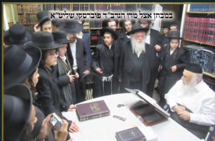
במבחן אצל מרן הגר"ד פוברסקי שליט"א