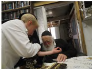
נער בר מצוה המתחיל להניח תפילין לראשונה, בנוכחות רבינו