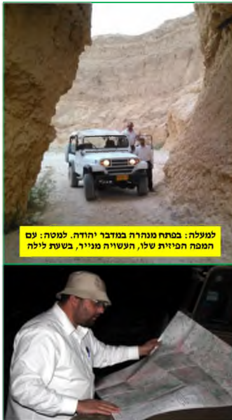
למעלה: בפתח מנהרה במדבר יהודה. למטה: עם המפה הפיזית שלו, העשויה מנייר, בשעת לילה