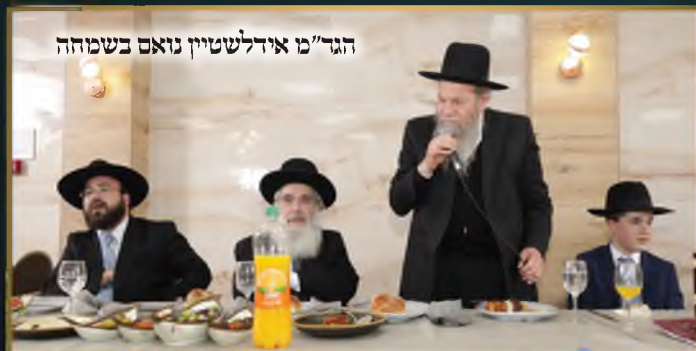
הגר"מ אידלשטיין נואם בשמחה