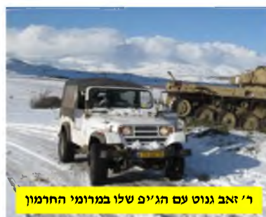
ר' זאב גנוט עם הג'יפ שלו במרומי החרמון

'מורי הדרך והמדריכים של ימינו כל-כך שעברו את עצמם למכשירי הניווט, שאיבדו כבר לחלוטין את חוש-הניווט העצמי שלהם, ואם תבקש מהם לאתר נקודות אורך-ורוחב במדבר, ובמקרה המכשירים שלהם יתקלקלו, הם לא ימצאו שם את ידיהם ורגליהם. לעומת זאת, מי שלא מצויד במכשירים אלה, התרגל לפתח גישות מקצועיות, והוא מכיר ומזהה בחושים אלה את כל התוואים וההצטלבויות'. הרב גנוט, בן ה-43, מתפקד מזה כ-20 שנה במקצועו כמדריך טיולים, והוא