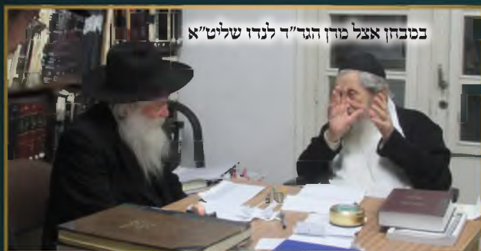
במבחן אצל מרן הגר"ד לנדו שליט"א