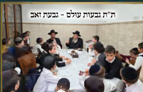
ת"ת גבעות עולם - גבעת זאב