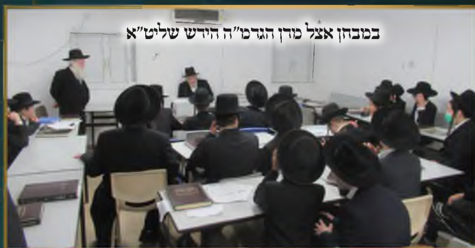
במבחן אצל מרן הגר"מ"ה חירש שליט"א