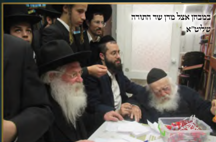
במבחן אצל מרן שר התורה שליט"א