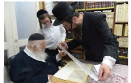
רבינו בוחן פרשיות תפילין עבור נער בר מצוה