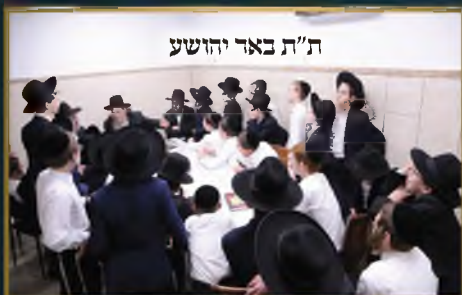
ת"ת באר יהושע