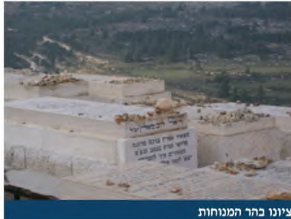
ציונו בהר המנוחות

(תודתנו נתונה להרב אברהם ארנטריו על סיועו בהכנת המאמר).