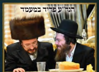
הגר"ע פריד במעמד