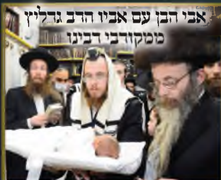
אבי הבן עם אביו הרב גרליץ ממקורבני רבינו

מרן הגרמ"ש אדלשטיין שליט"א מעניק את הספר "בעקבי אמונה" על רמב"ם הל' שמיטה ויובל משיעורי אביו זצוק"ל למדן דשכבה"ג שה"ת שליט"א