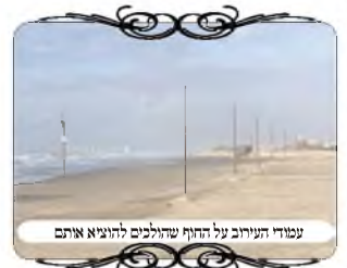
עמודי העירוב על החוף שהולכים להוציא אותם

בימים אלו של תקופת החורף הגשום, יש עוד דוגמא מצויה, שיש בישובים תעלות מים גדושות וזורמות, ובשבת הולכים יחד עם הילדים לראות את זרימת המים המשקשקת, וזה מטעה מאד שלא ישימו לב ויצאו מגבול העירוב. דוגמא אחת מצויה בעיר מודיעין עילית, שהנחל העובר ליד כפר גרין פארק מתמלא בזרימת מים, ובשבת בצהריים הולכים משפחות רבות לחזות ביופי הבריאה, בפרט לתושבי עיר שאינם מכירים הרבה את הטבע, עד טיול מיוחד לצאת אל הנחל. אבל כל האזור נמצא מחוץ לעירוב של העיר, העירוב מסתיים בכביש שבכפר, ואין שום אפשרות להוציא שום חפץ, לא טישו בכיס, ולא בקבוק מים או ממתק, ואפילו לא ילד על הידיים, כמו שכותב המשנ"ב (סי' ש"א ס"ק קנ"ד) שרבים טועים לומר "חי נושא את עצמו", אבל זה אסור מדברגן גם במקום שאינו רשות הרבים רק כרמלית, כגון ביער ושפת הנחל.