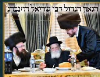
הגאון הגדול רבי שריאל דזונברג