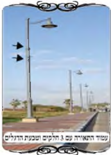
עמוד התאורה עם 3 חלקים וטבעת הדגלים