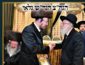
הגר"צ הגר"ש גלאי