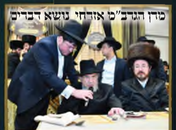
מרן הגרמ"מ אזרחי נושא דברים