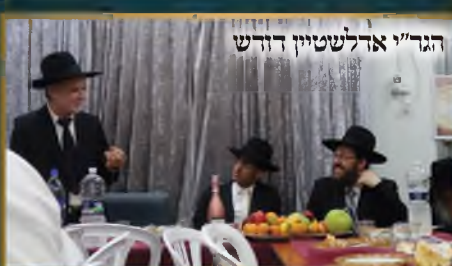
הגר"י אדלשטיין דורש