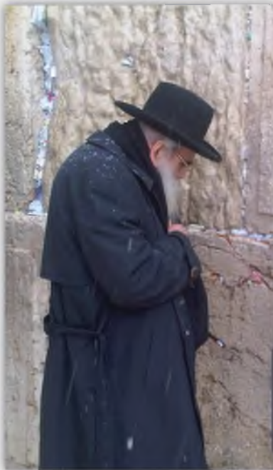
בתפילה בכותל לפני ההדלקת נרות

מובא בחז"ל הק' [מגילת אנטיוכוס א, יא] שאנטיוכוס הרשע גזר על עם ישראל בעיקר על שלשה דברים , שלא ישמרו שבת, ושלא ימולו את בניהם, ושלא יקדשו את החדש. ועמדו המפרשים על סוד הענין , שגזרו בעיקר על שלשת מצוות הללו .