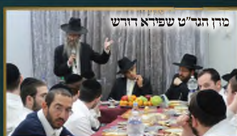
מרן הגר"ט שפירא דורש