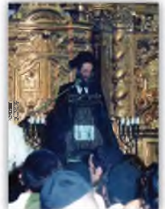
הגרמ"ש זצ"ל מספיד את חמיו מרן הקה"י בהיכל ישיבת פונבז'

מרן החזון איש, רבו המדריכו בנתיבות העיון וההלכה, חפץ בו לחתן לבת אחותו הרבנית אהובה ע"ה, לא מפני הכשרונות העילויים בהם ניחן, ולא מפני עומק לימודו בלבד. אלא מפני מעשה שהיה. וכך סיפר רבינו: דודי החזון איש היה רגיל להשכים בבוקר לתפילת 'ותיקין', אבל הורה לבן ביתו ר' שלומק'ה להתפלל בישיבת פונבז', כששב החזון איש מן התפילה, כבר