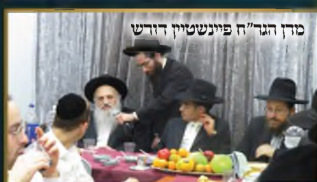
מרן הגר"ח פיינשטיין דורש