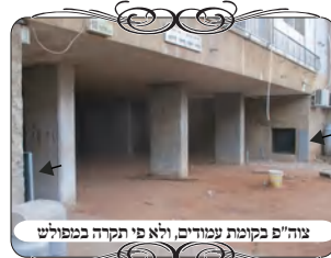
צוה"פ בקומת עמודים, ולא פי תקרה במנוולש

בגינה זו היה קושי לעשות עירוב, כיון שמדובר בבנינים ישנים מהתקופה שהיו בונים על קומת עמודים, כלומר שאין דירות ואין קירות בקומת קרקע, אלא תחתית הבנין פתוח מכל הכיוונים. כמו כן החצרות אינן גדרות, אלא יש רק מעט צמחיה קטועה שאי אפשר לסמוך עליה לעירוב כלל, [והיא רק יכולה להפריע כשהיא מחיצה תחת צורת הפתח]. וכן הגדרות החדשות שעשו לגינה נמוכות, ואינו בשיעור י' טפחים. לכן היה צורך לעשות את היקף העירוב על ידי הרבה צורות הפתח קטנות מבנין לבנין, ואף תחת הבנינים כיון שהם פתוחים מכמה צדדים. [ולא עשו היקף של עמודי עירוב סביב כל הבנינים, כי אין מקום שאפשר להעמידם כדן, וגם שאינם מועילים לדעת הרמב"ם המובא ב"י ש"ס ס"י].