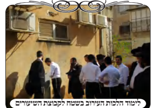
לימוד הלכות העירוב בשטח לקבוצת השיעורים

בעבודת העירוב היה צריך שימת לב להרבה הלכות, למרות שזה נראה פשוט למתוח חוט מבנין לבנין ולהעמיד לחיים תחתיו, בכל זאת בכל לחי היתה התלבטות מהו המקום המתאים, ובאיזה צורה לחברו. ולאחר החג עשינו סיור שלם לאברכים שלומדים כעת בשיעורים, ללמוד את כל החשבונות ההלכתיים והפרקטיים שהיו בהקמת עירוב זה. היו מקומות שהיה גדר או צמח גבוה באמצע החצר, והיה צריך להזיז את צורת הפתח שלא תעבור עליו. ובמקומות שהגדר פחות מכשיעור, מותר שצוה"פ תעבור מעליה. וכן היו מקומות שהעמדנו לגזום את העץ לצורך הקמת העירוב בצורה הטובה. כמו כן במקומות שיש מרפסת בקומה שניה, וכאשר מחברים את הלחי לבנין יוצר שיש תקרה מעל הלחי [שהוא העמוד], יש לחשוש לחומרא שמדין פי תקרה נחשב כרשות בפני עצמה, והרי זה כמו שהעמיד את העמוד בתוך חצר מוקפת מחיצות, שכתב המשנ"ב (סי' שס"ג ס"ק ק"ג) שלא עשה כלום. ואע"פ שאין כאן מחיצות ממש, מ"מ הוראת גדולי הפוסקים שגם מחיצה דרית מחלקת לענין זה, [מלבד עומד מרובה שכתב החזו"ש שאינו מחלק את צוה"פ].