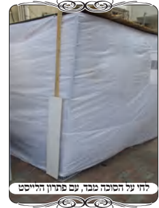
לחי על הסוכה מבד, עם פתרון הלייסט

בשנה זו הגיעה אלינו שאלה חדשה, מאחד האברכים שלמדו במסגרת השיעורים ונהיה אחראי על העירוב בשכונת מגוריו, ובערב החג גילה שאדם העמיד סוכת נחלים מבד תחת חוט העירוב, והתקשר לשאול האם בסוכה כזו שאפשר להריה ולהזיז אותה שלימה, נוכל להתיר מהסברה שהיא דבר זמני שאינו מחלק את המקום כמו מכונית. אמרנו לו שיש בזה סברה, אך יתכן שבכל זאת נחשב כמבנה ולא ככלי המיטלטל. הפנינו את השאלה אל הגאון ר"מ לובין שליט"א, והוא הורה שכדאי להחמיר. [יש להוסיף לתועלת העוסקים, שבסוכה זו היתה לו בעיה לחבר לחי מבחוץ, כי המחיצה היא רק בד. ואמנם בהרבה סוכות יש ברזל באמצע או כמה פסי רוחב, אבל כאשר הם בתוך הסוכה והבד מבחוץ, אין אפשרות לחבר להם מבחוץ. הוא חזר אל מוקד העירוב ושאל הפעם מה הפתרון הפרקטי לחבר לחי. אמרנו לו שיקח קרש דק [לייסט] באורך שני מטרים [כגובה הסוכה], ויחבר אותו עם אזיקונים לברזל שלמטה מתחת הבד, ולברזל שלמעלה מעל הבד, ועליו יצמיד את הלחי. וכך הוא עשה.