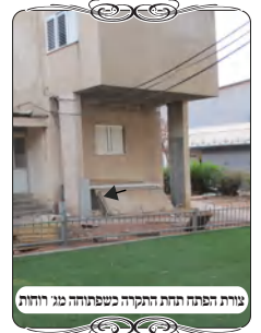
צורת הפתח תחת התקרה כשפתוחה מג' רוחות

אמנם באופן שהתקרה שמעל העמוד פתוחה מג' רוחות, הוראת הרבנים שמותר להעמיד את העמוד או הלחי תחתיה, כיון שבאופן זה ק"ל שאין אומרים דין פי תקרה יורד וסותם, [דלא כשיטת רש"י], ואפילו להקל ניתן לסמוך על כך, לכן כאשר רק המרפסת בולטת מקו הבנין, אפשר להצמיד את החוט והלחי מתחתיה, משא"כ כאשר הבנין מתרחב בצד אחד, ויש מחיצה למטה משתי רוחות, אין להעמיד את צורת הפתח באופן שהעמוד או הלחי תחת התקרה. [אא"כ כל הפתח תחת התקרה, שאז אין חילוק רשות באמצע הפתח.