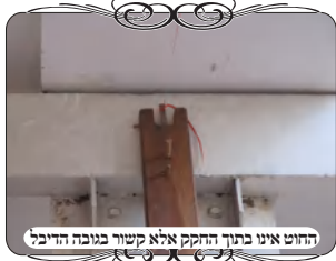
החוט אינו בתוך החקיקה אלא קשור בעובה הדיבל

ועמוד ישר תחת החוט, ויתחיל בתוך ג' טפחים לקרקע. בחג עברנו לראות את העירוב, וראינו שהשתמש בעמוד עם חקיקה, וקשר את החוט בתוך החקיקה, באופן שההוראה בעירובים השכונתיים שלא להכשיר בצורה כזו, כי המשנ"ב נוקט להחמיר בה. על דבר זה לא חשבנו לומר לו, כמו עוד כמה הלכות שהיו יכולים לקרות בשינוי כלשהו.