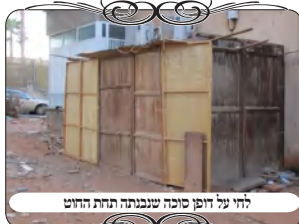
לחי על חוט סוכה שנבנתה תחת החוט

דבר נוסף שהיה נוגע בעירוב הקטן הזה, והוא היה גם בהרבה עירובים בחודש זה, שבנו סוכה תחת החוט של העירוב. במצב כזה יוצא שיש רשות נפרדת תחת החוט, וגם אם היא אינה מקיפה את העמוד והלחי, מ"מ נוקטים לדינא שהיא מחלקת את הפתח ופוסלת את העירוב. אמנם יש כלל שדבר זמני אינו פוסל את העירוב, כגון מכונית שעומדת כל השבת תחת החוט, וכן פח ירוק או פח צפרדע שעומד תחת החוט, אע"פ שהם רשות היחיד בפני עצמה, אינם פוסלים את העירוב, [ע"פ המבואר בחזו"א ס"ס ע"א], והטעם משום שישוד הפסול הוא כי הדבר מחלק את מקום