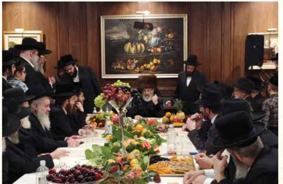
חמשה עשר בשבט תש"פ