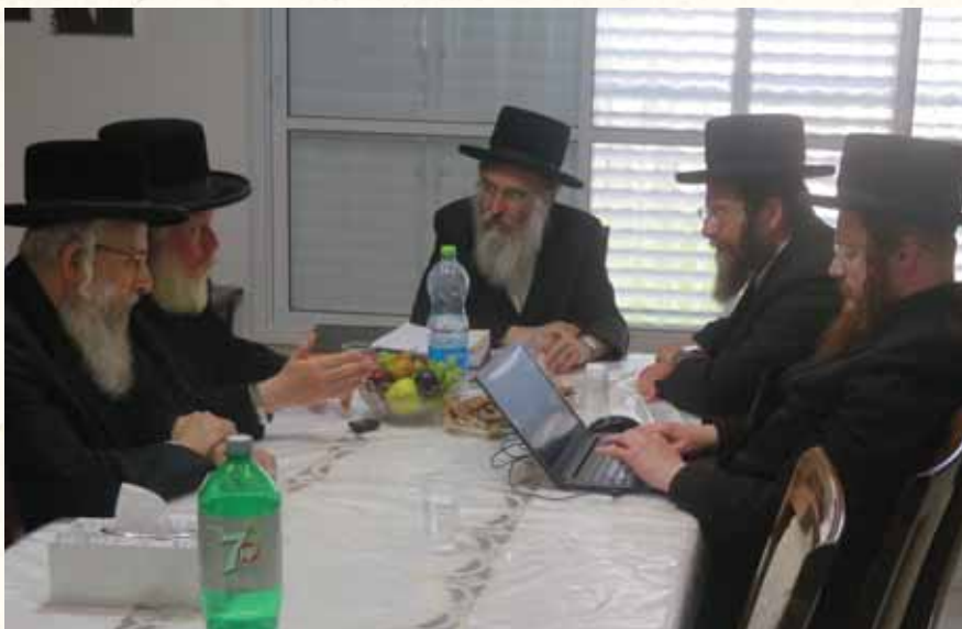
ידידות תזכור ממנעימך. חשובי ונכבדי חצר הקודש סאדיגורה בשיח יקרות לקראת מלאות שנה להסתלקות רבנו זצוק"ל

"כך גם ידוע שבכל ליל שבת קודש היה רבנו אומר 'תורה' על נושא מסוים של שבת קודש, עד שלכאורה הנושא של שבת הוא הערך עליו דיבר רבנו הכי הרבה, כשהוא מקיף לאורך השנים את כל הנקודות והזוויות של שבת קודש מכל הצדדים והפרטים, עד שבע"ה עתיד לצאת ספר מיוחד מכל המאמרים שנשמעו