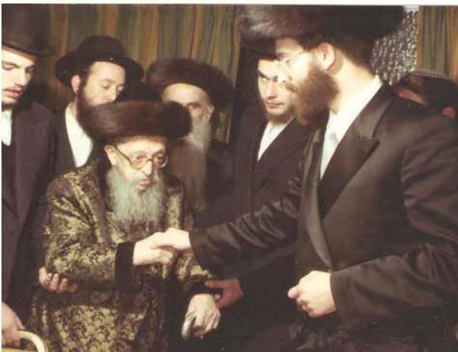
מסר לו רזי תורה וגיונוי מלכות. רבנו מקבל ברכת זקנו מרן ה'כנסת מרדכי' בימי השבע-ברכות