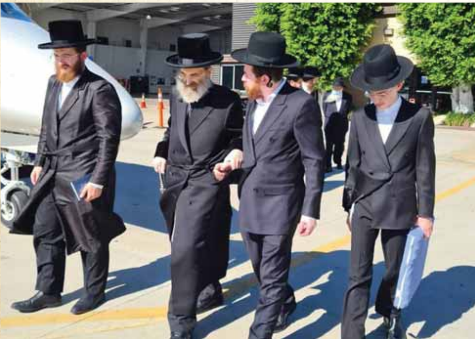
מסירות נפש. בשדה התעופה בשו בו בפעם האחרונה לארה"ק

גם כעבור שנה שלמה, בני הקהילה בלוס-אנג'לס מדברים על רבנו וצוק"ל כאילו רק אתמול היה שם, מתקשים להשלים עם החסר ולהאמין כי איננו עוד כי לקח אותו אלוקים. יהודים מספרים בבכי כי לא עובר יום שדמותו של רבנו לא עולה וצפה לנגד עיניהם, יחד הם משחזרים את הרגעים הנעלים והמרומומים בצל קורתו, שיישאר בוודאי חקוקים על לוח ליבם לנצח.