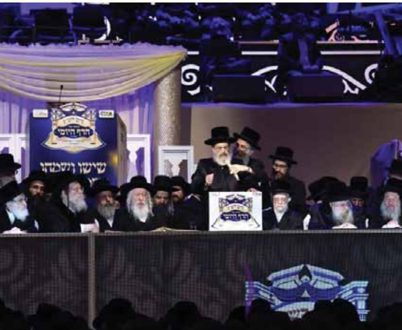
בצרתם לו צר. רבנו זי"ע נושא מדברות קדשו במעמד סיום הש"ס בירושלים סבת תש"פ