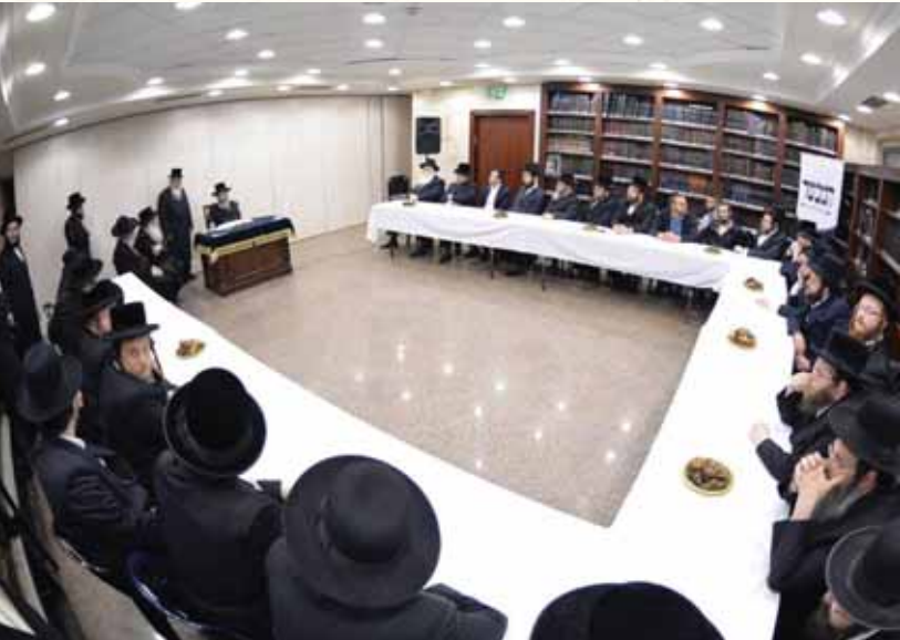
מסר מרכזי בשיחה לצוות המבשר. רבינו בשיחה לצוות 'המבשר'