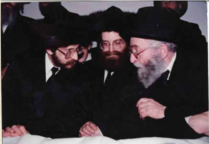
במגוון נושאים חינוכיים בחסידויות שונות. עם להבחל"ח כ"ק מרן אדמו"ר מבאיאן שליט"א

זכרתי ימים מקדם, כאשר אי שם באמצע החורף הגיעה לרבנו בני משפחה מעדות המזרח אשר בנם שהיה כבר כבן ארבע, שעד כה גדל תחת סינר אמו, ומעולם לא היה במסגרת חינוכית. וכאשר הבינו שהגיע עת 'חנוך לנער' פנו בצר להם לרבנו שסייע להם להכניסו לתלמוד תורה. רבנו לקח זאת על עצמו כפרויקט אישי,