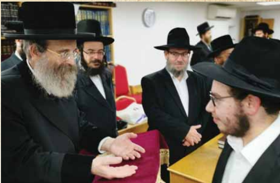
הארת פנים ואהבת ישראל. רבנו בביקורו בקהילתו בלונדון בשנים האחרונות