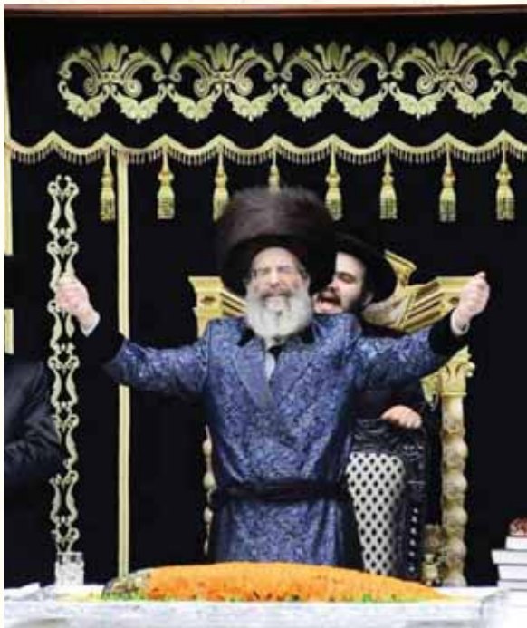
אשרי עין ראתהו. ריקוד נלהב בשולחן הטהור במוצאי פורים

"רבנו היה מושלם בכלילת המידות והמעלות בכל תחום שרק יהיה. משנות לימודו ביישיבת פוניבז' רכש קרבה יתירה אצל גדולי ליטא בדורו והיה מרבה להתפלפל עמם בעיון ובלומדות, כאשר כל ביקור של רבנו אצל אחד מגדולי ליטא הפך להתנצחות