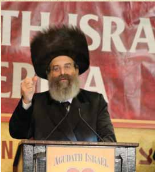
רושם של חודשים. רבנו נואם את נאום החינוך חוצב הלהבות בוועידת אגודת ישראל בארה"ב