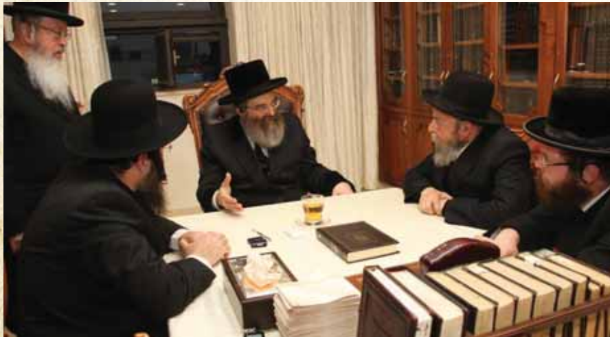
במשא העם. רבנו זי"ע בשיחת קודש במעון קדשו לצוות 'המבשר'

שעה ארוכה ישבנו מרותקים וצמודים לפרקי הזיכרונות שנשפכו וקלחו מפיהם של אנשי שיחנו היקרים שיחי', בהעלותם על נס זיכרונם את השעות הנפלאות והרגעים המיוחדים בהילו נרו של רבנו זצוק"ל עלי ראשם בחיים חיות. בנימה אחת מסיימים כולם את השיחה אפופת הגעגועים ורוויית הדמעות: 'מה כאן עומד ומשמש אף שם עומד ומשמש', בוודאי ימשיך רבנו ללוות אותנו משמרי רום באהבתו ובחמלתו הנודעת, להרעיף עלינו ועל כל ההולכים לאורו שפע ברכות וכל מילי דמיטב, לטוב לנו כל הימים, אמן ואמן.