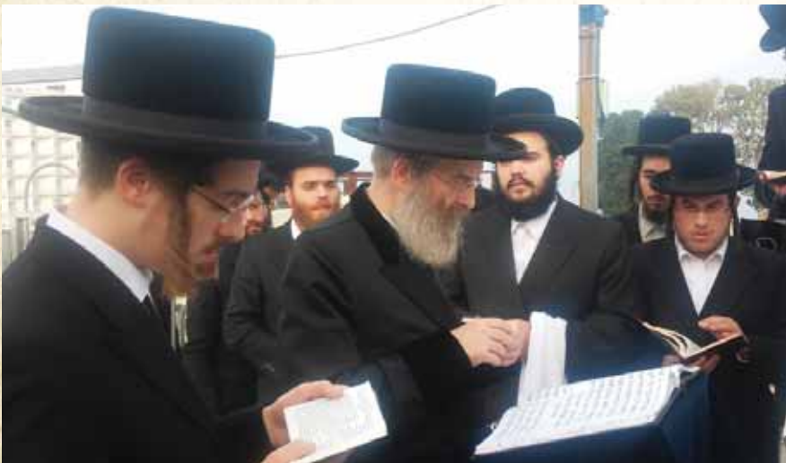
טעם אמיתי בתפילה. רבנו זי"ע בתפילה על ציון אביו כ"ק מרן ה'עקבי אבירים' זי"ע עם בנו יבלחט"א כ"ק מרן אדמו"ר מסאדיגורה שליט"א