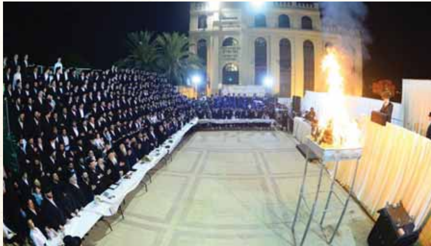
נמשחת אשריך. מעמד ההדלקה בל"ג בעומר ברחבת בית המדרש הגדול