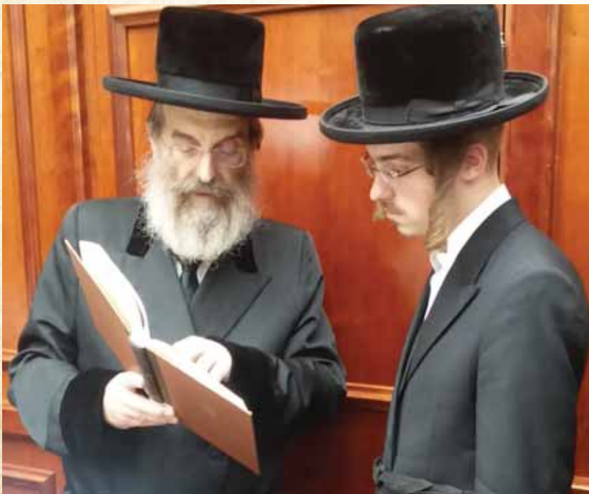
דרך לימודו של הרבי. בשיח תורני עם יבלחט"א בנו כ"ק מרן אדמו"ר מסאדיגורה שליט"א

"השנים הנפלאות האלו" מפטיר הגרא"מ, "שנות נצח של התמדה ושקיעות עצומה בתורה הק', בוודאי נהפכו לחלק ויסוד באישיותו הגדולה והרוממה ומכוחה גדל והתעלה לשמש ברבנות ובהוראה, ובשנותיו האחרונות בהנהגת העדה הק' אשר רוממם בקנייני התורה והעבודה עד לאין שיעור לאות ולמופת בישראל. זכותו יגן עלינו ועל כל ישראל".