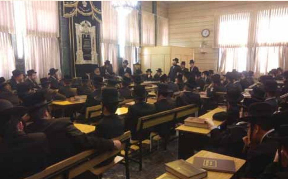
לדאוג לבחורים. במעמד סיום הזמן בישיבה

"טייערע אידן! אינכם משערים עד כמה גדולה המצוה הזאת, כשהודי רק שומע שיחת טלפון שמציעים עבורו הצעת שידוך לבנו או לבתו זה ממש מחיה נפשות, ומקיימים בזה 'כל המציל נפש אחת מישראל כאילו קיים עולם מלא'".