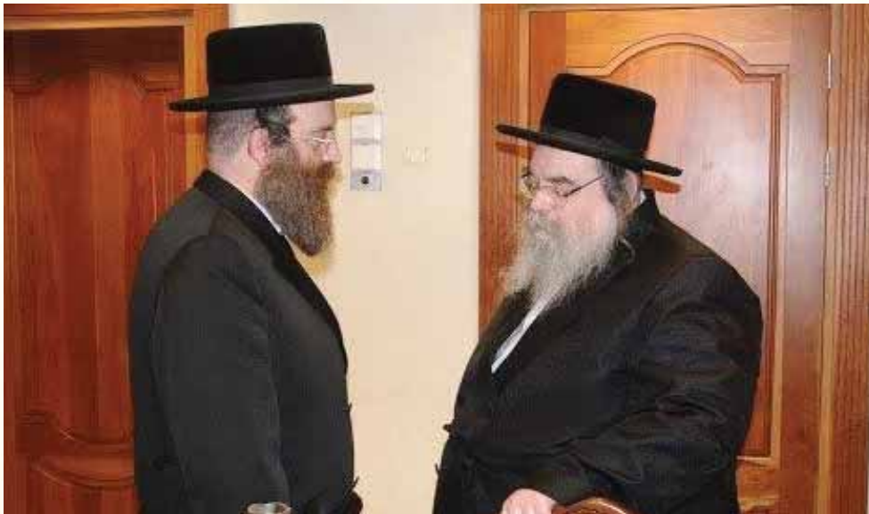
למען המוני בית ישראל בכלל. בסוד שיח עם כ"ק מרן אדמו"ר מבעלזא שליט"א