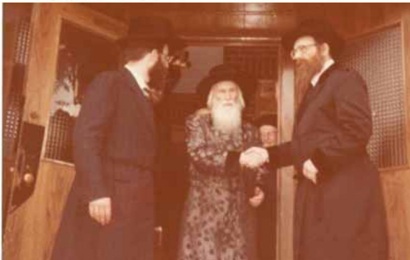
בני היכלא דכסיפין. רבנו זי"ע עם אביו כ"ק מרן ה'עקבי אבירים' זי"ע וכ"ק מרן אדמו"ר רבי ישראל מבלאזוב זי"ע